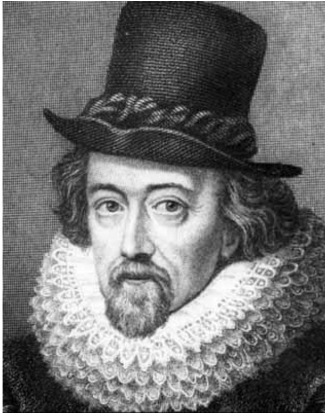
Фрэнсис Бэкон 1561-1626

Английский философ, основоположник эмпиризма Нового времени.