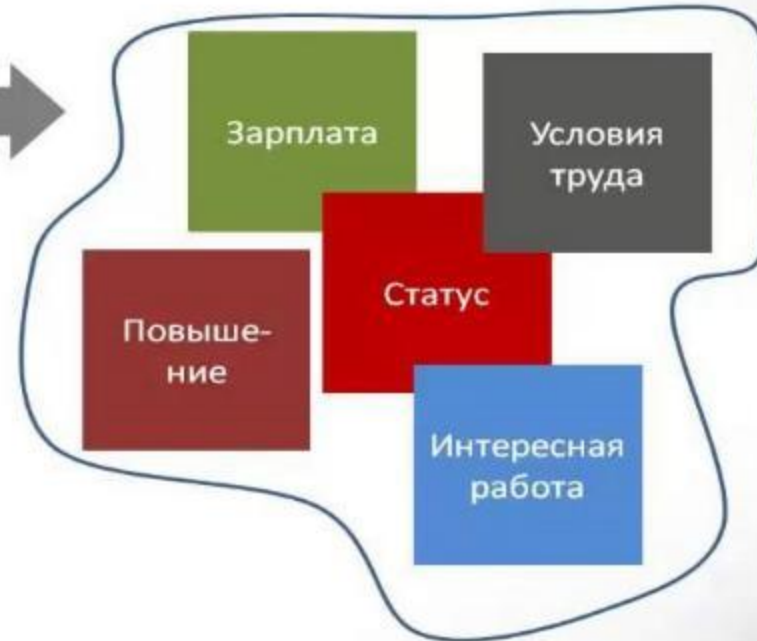
Возможная отдача за усердие (по мнению работника)