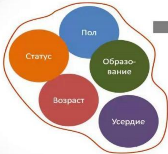
Факторы вклада в работу (по мнению работника)