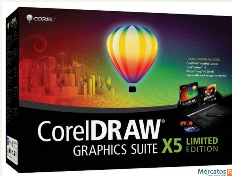
Corel Graphic Suite-коммерческий пакет