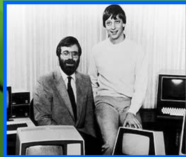
Пол Аллен и Билл Гейтс 19 октября 1981 сразу после подписания контракта с IBM