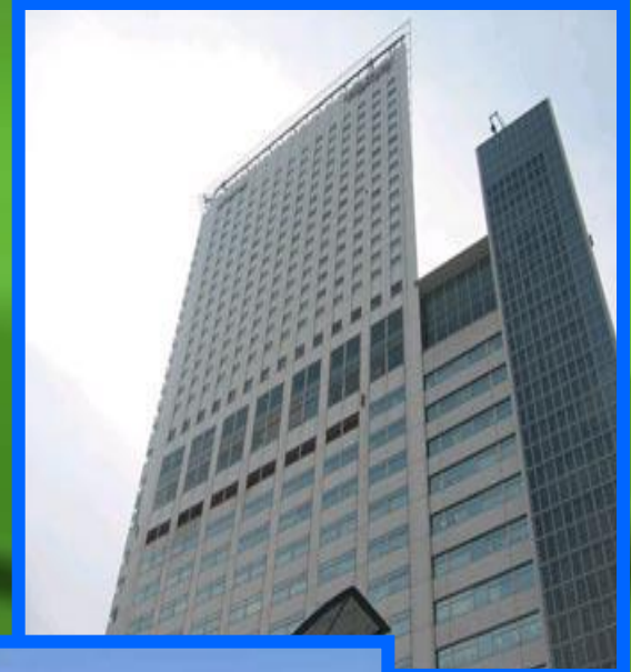
Небоскреб в Токио

• Однако несмотря на все проблемы, Microsoft остается лидером в сфере компьютерных технологий и программного обеспечения.