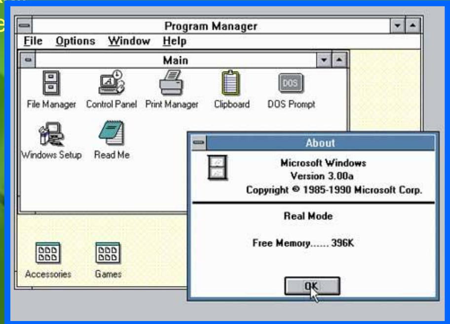
Внешний вид Windows 3.0

• Параллельно с Windows компания Microsoft разрабатывала множество приложений для своей операционной системы: Office, Media Player, Internet Explorer и др.