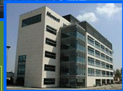
Офис в Сиэтле