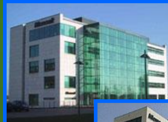
Здание в Берлине