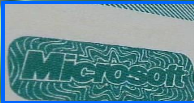
Знак качества Microsoft на каждой детали