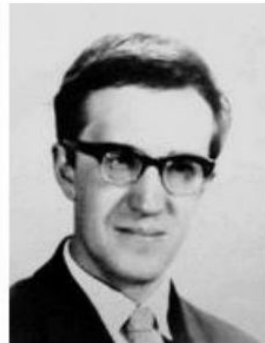
Андрей Личко (1926-1994)