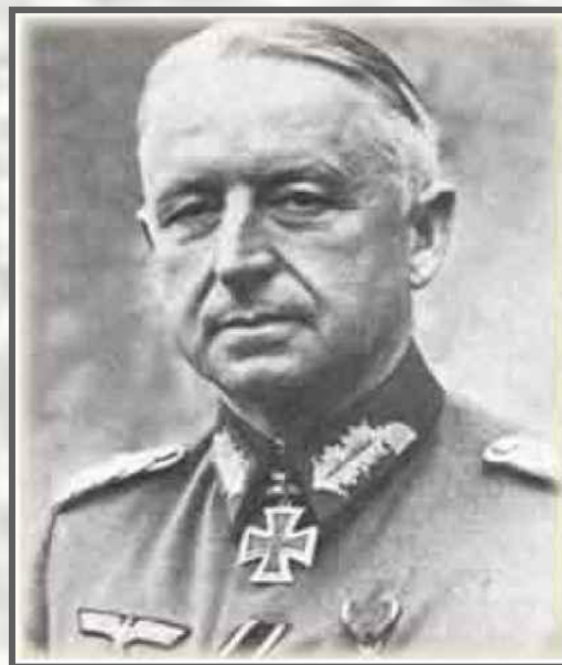
Э. фон Манштейн

Группировкой армий «Центр», нападавшей с севера командовал генерал-полковник Вальтер Модель, группировкой армий «Юг», нападавшей с юга командовал генерал-фельдмаршал Эрих фон Манштейн.