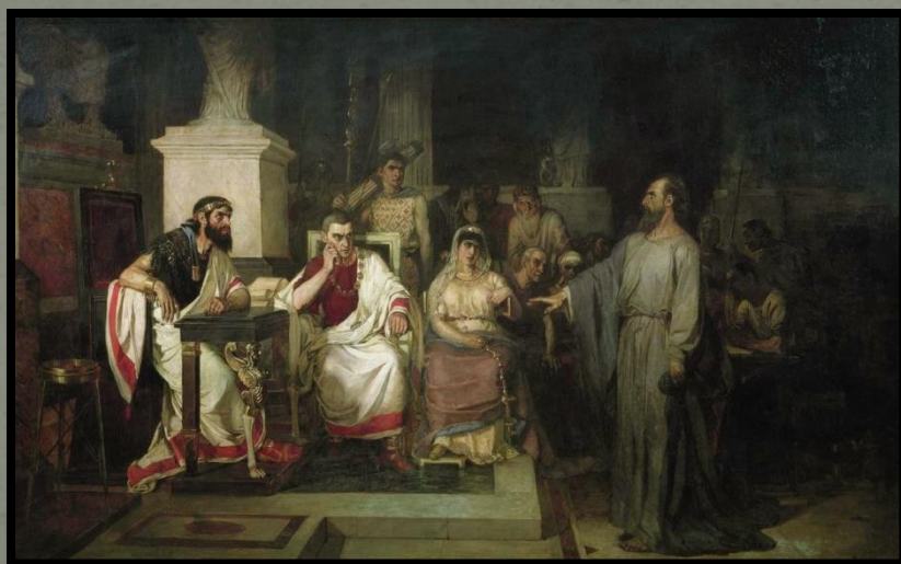
Апостол Павло, що пояснює догмати християнства Іроду Анриппі, його сестрі Береніці та римському проконсулу Фесту», 1875