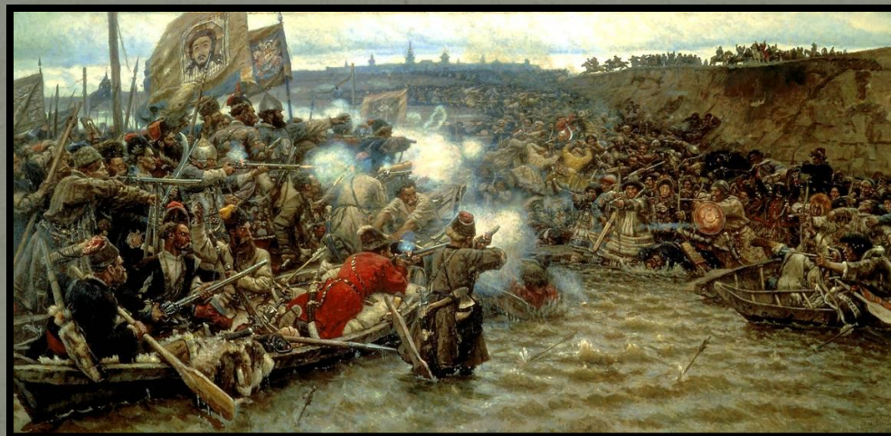
Підкорення Сибіру Єрмаком