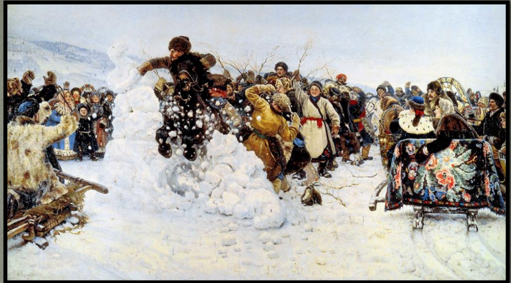
Захоплення снігового містечка