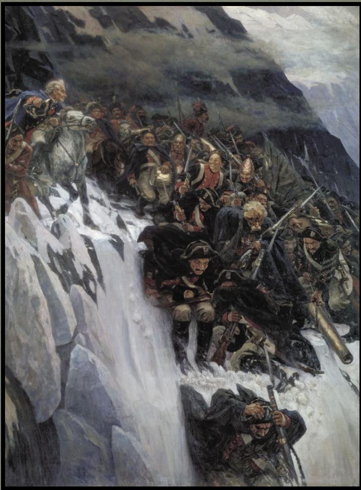
Перехід Суворова через Альпи

Творчий процес наздоганяв митця у несподіваних місцях. Вліку 1881 року, в дощові дні перебування з родиною в сільці Перерва неподалік станції Любліно Суриков наштовхнувся на новий для себе сюжет — заслання князя Меншикова. Тісна селянська ізба, глухотинь, нудьга і неможливість працювати і навіть вільно дихати — повернули уяву художника до чужої біографії, до сильної особи, що влучно використала щасливий випадок, піднялася до вершин влади і все втратила.