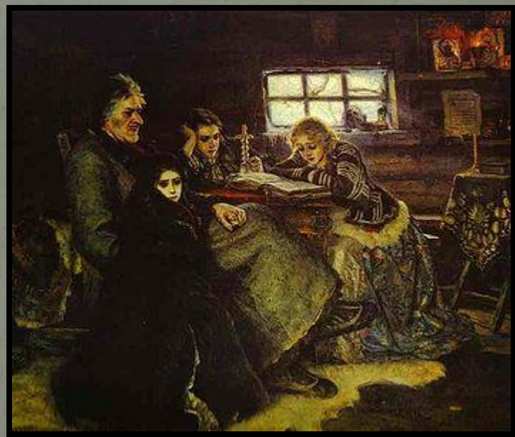
Меншиков в засланні у Березові

Творчий процес наздоганяв митця у несподіваних місцях. Вліку 1881 року, в дощові дні перебування з родиною в сільці Перерва неподалік станції Любліно Суриков наштовхнувся на новий для себе сюжет — заслання князя Меншикова. Тісна селянська ізба, глухотинь, нудьга і неможливість працювати і навіть вільно дихати — повернули уяву художника до чужої біографії, до сильної особи, що влучно використала щасливий випадок, піднялася до вершин влади і все втратила.