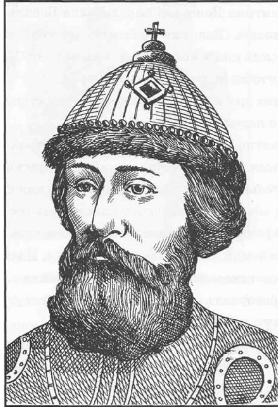
Великий князь «всея Руси»