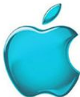
1998 Translucent Version