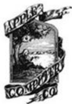
1976 By Ron Wayne