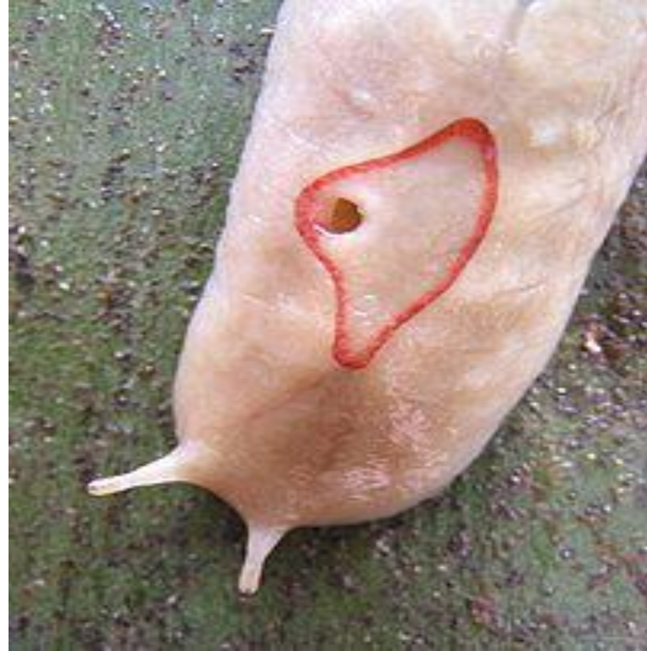
Пневмостом — особый дыхательный орган, присущий ряду представителей лёгочных улиток. Представляет собой лёгочное отверстие, выходящее наружу. Является частью дыхательной системы.