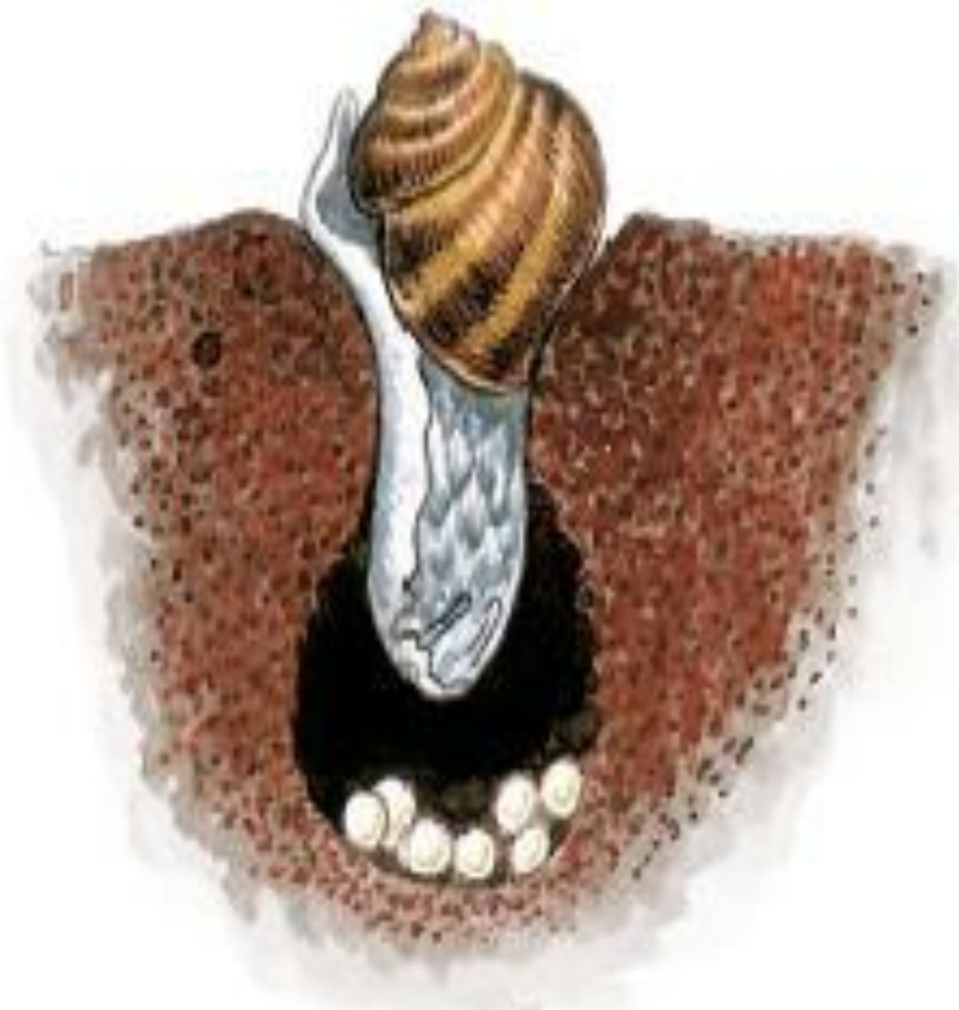
Рис. 75. Виноградная улитка, откладывающая яйца

Оплодотворение у этих моллюсков перекрестное: каждая из спаривающихся особей играет роль и самца, и самки, поэтому происходит обмен генетическим материалом разных особей. Из отложенных оплодотворенных яиц развиваются маленькие моллюски, похожие на взрослых животных (рис. 75).