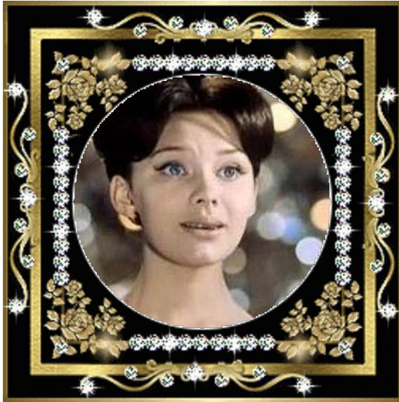
Людмила Савельева в роли Наташи Ростовой

В романе Наташа Ростова представляет собой утончённую, одухотворённую девушку.