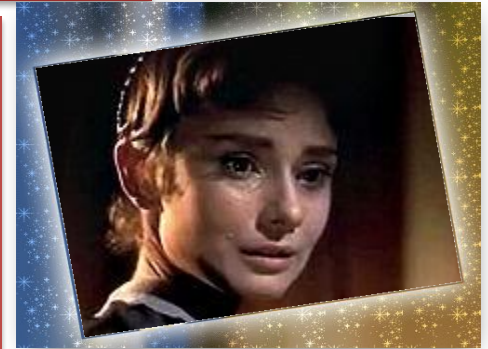
Одри Хепбёрн в роли Наташи в голливудской экранизации 1956 года.

"Черноглазая, с большим ртом, некрасивая, но живая девочка, с своими детскими открытыми плечиками, которые, сжимаясь, двигались в своем корсаже от быстрого бега, с своими сбившимися назад черными кудрями, тоненькими оголенными руками и маленькими ножками в кружевных панталончиках и открытых башмачках..."