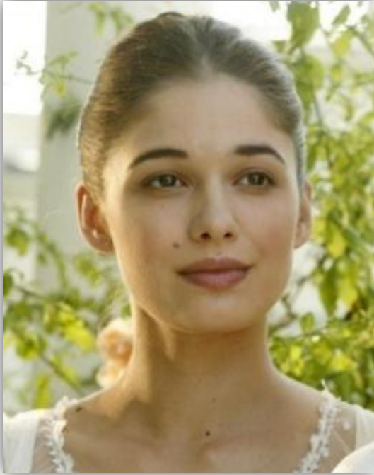
Ана Катерина Морарью в образе Сони в сериале «Война и мир»