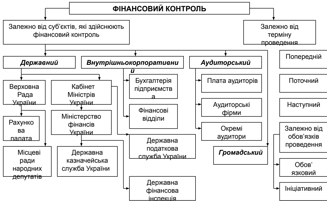
Механізм здійснення фінансового контролю в Україні