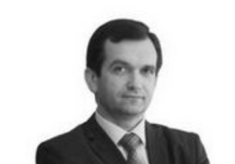
ЗАСТУПНИК МІНІСТРА ФІНАНСІВ УКРАЇНИ – КЕРІВ АПАРАТУ