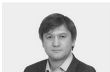
МІНІСТР ФІНАНСІВ УКРАЇНИ