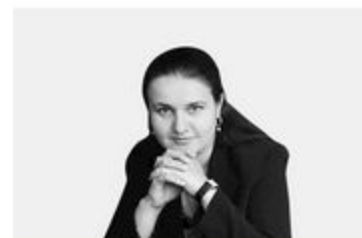
ПЕРШИЙ ЗАСТУПНИК МІНІСТРА ФІНАНСІВ УКРАЇНИ