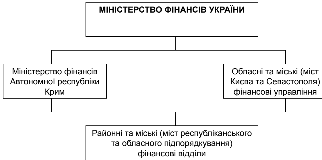
Регіональна структура Міністерства фінансів України