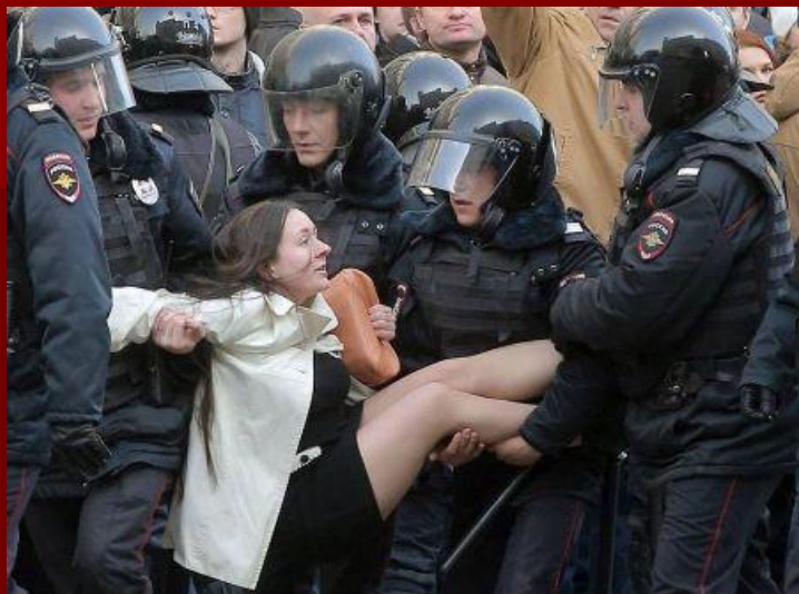
Фото с соответствующими комментариями моментально выкладываются в Интернет и всегда вызывают бурю праведного гнева у зрителя и лишь еще больше озлобляют толпу.