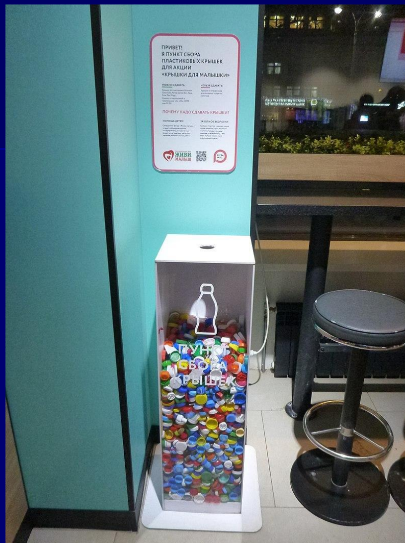
Пункт приема крышек от пластиковых бутылок в одной из точек общественного питания в Екатеринбурге, 2020 год