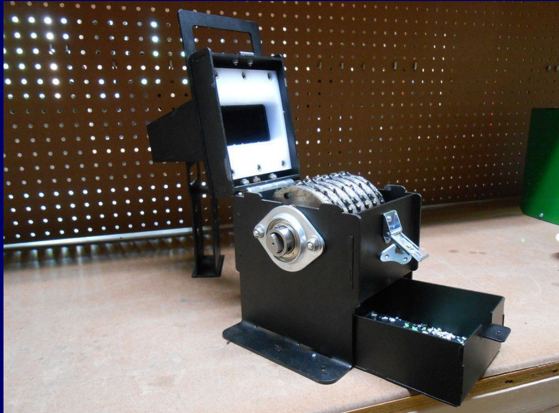
Оборудование для переработки ПЭТ бутылок