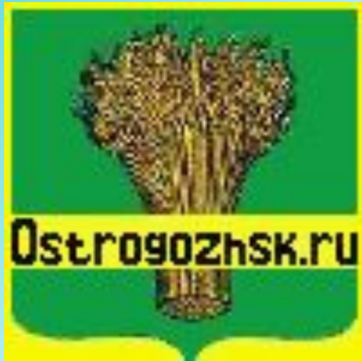
Герб города Острогожска