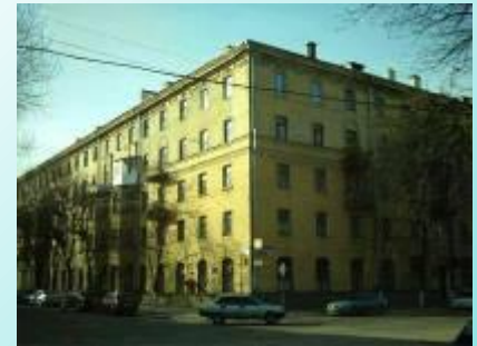
Дом в Воронеже, в котором жил писатель.