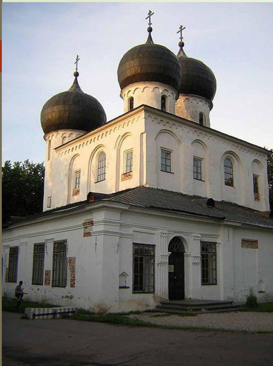
Собор Рождества Богородицы Антониева монастыря в Великом Новгороде. Заложен в 1117 году.