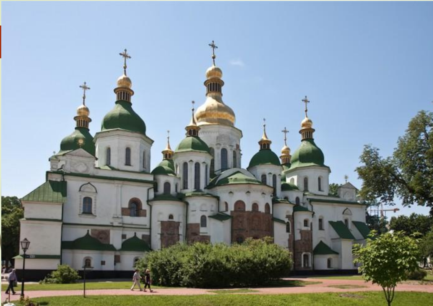
Собор Святой Софии в Киеве