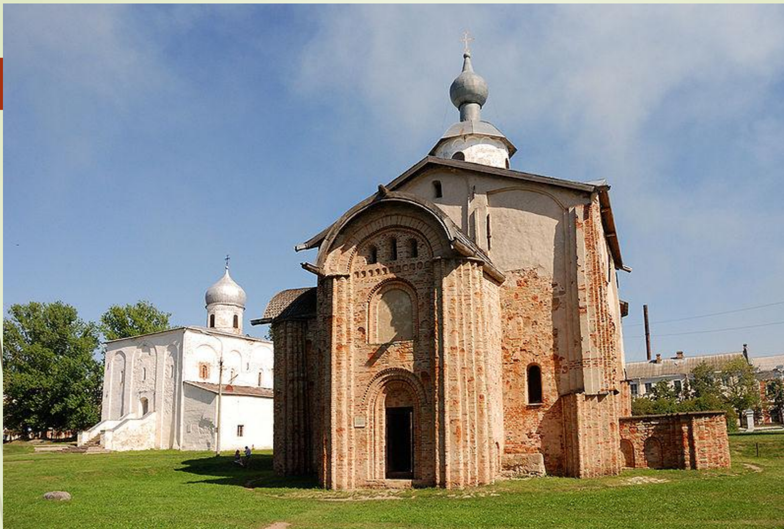
Церковь Параскевы-Пятницы в Великом Новгороде. 1207 год.