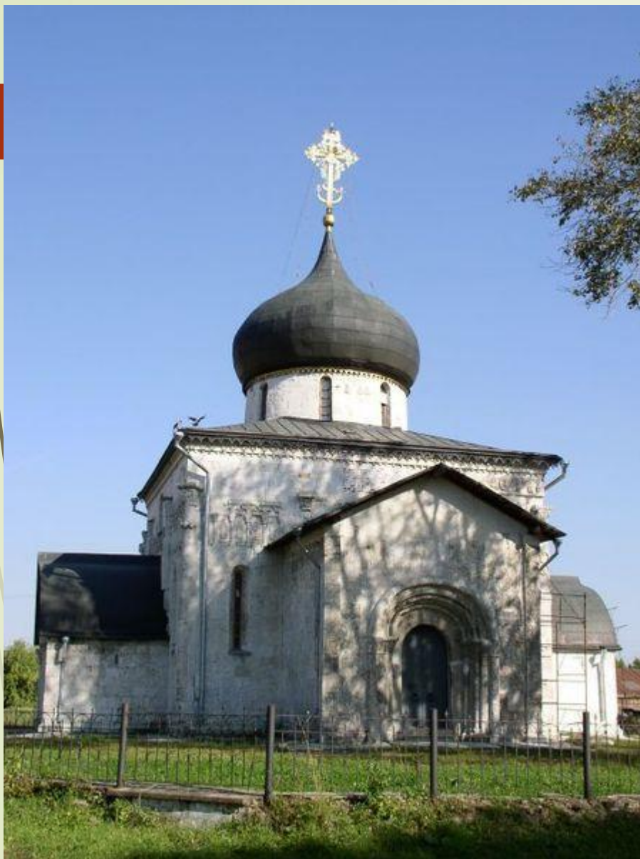
Георгиевский собор в Юрьеве- Польском. 1230—1234 гг.