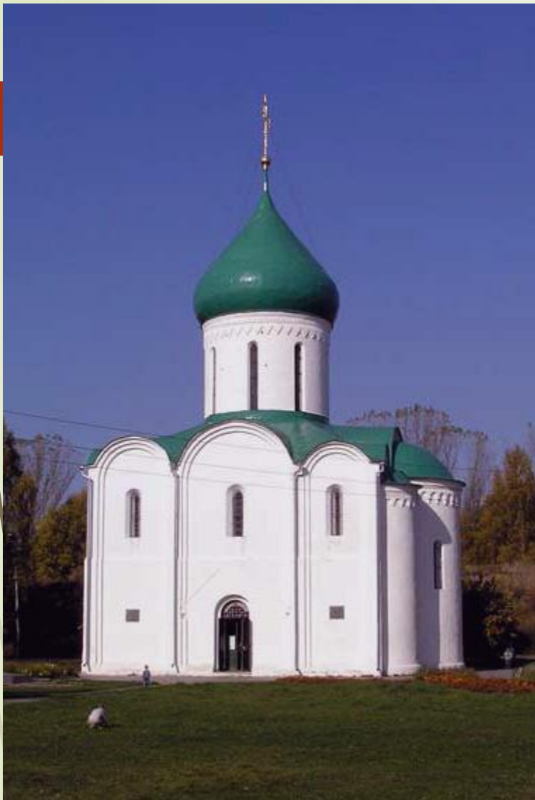
Преображенский собор в Переславле Залесском. 1152 год.