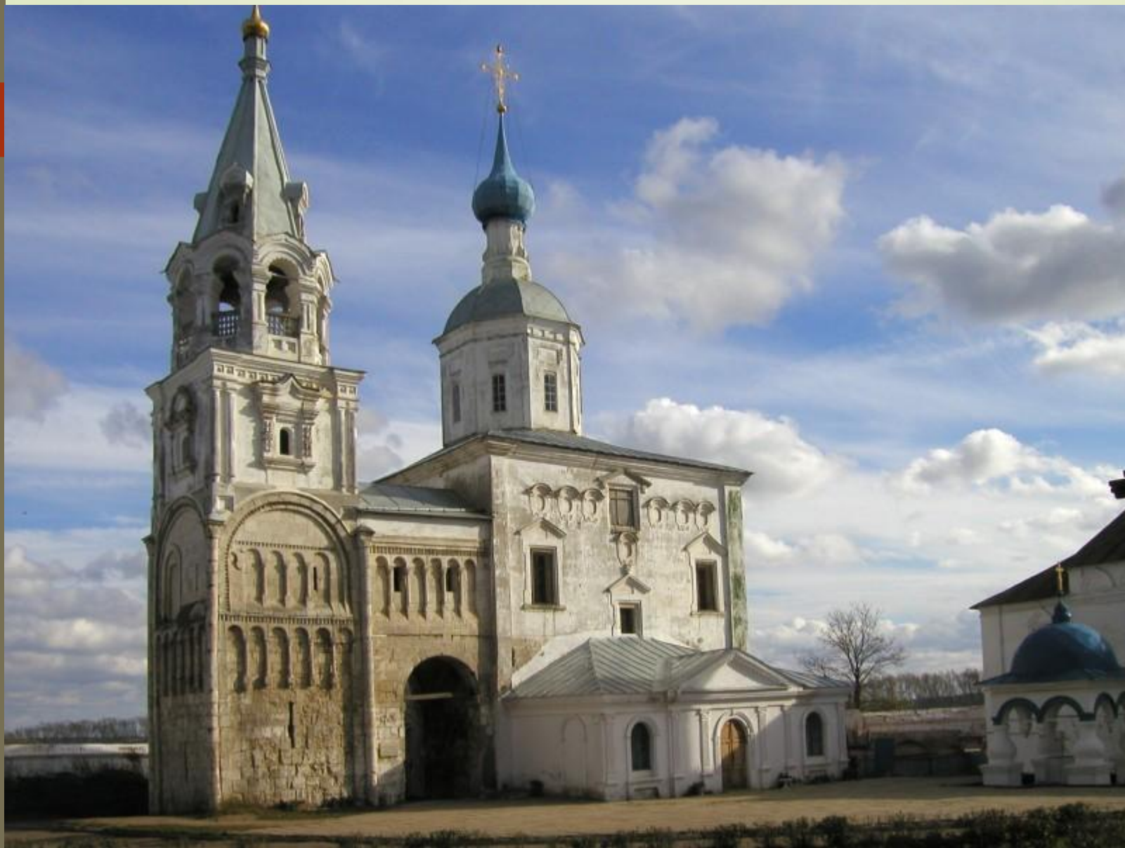
Храм Рождества Богородицы и остатки палат Андрея Боголюбского (ниже шатра колокольни)