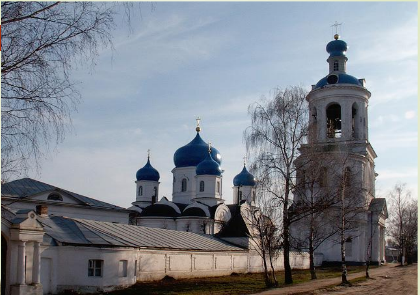
Дворцовый ансамбль в Боголюбове