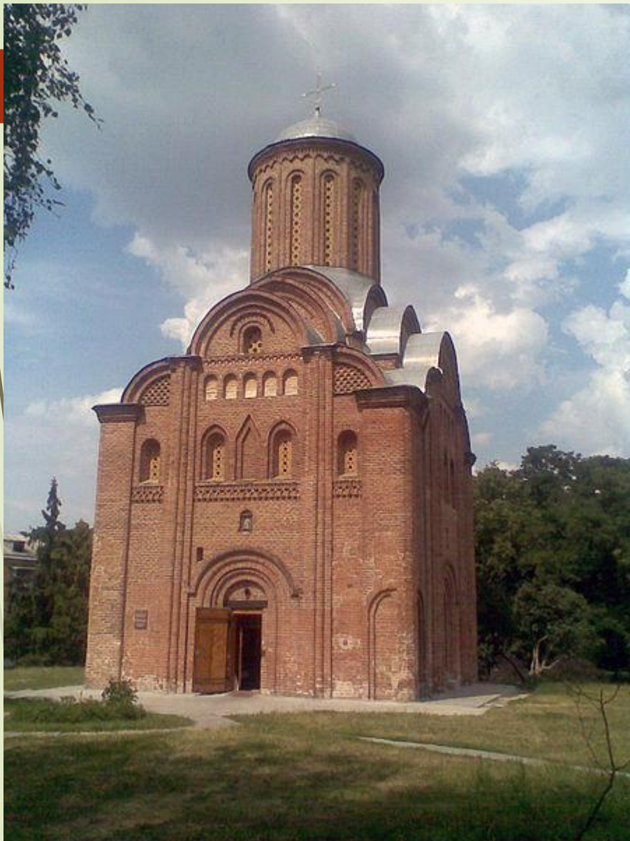
Пятницкая церковь в Чернигове. Конец XII века.