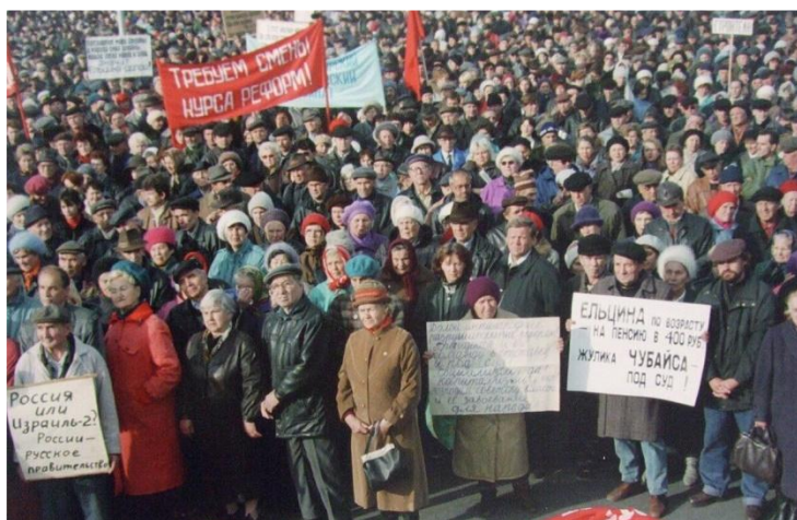
Безработица в России, 1995 – 2010