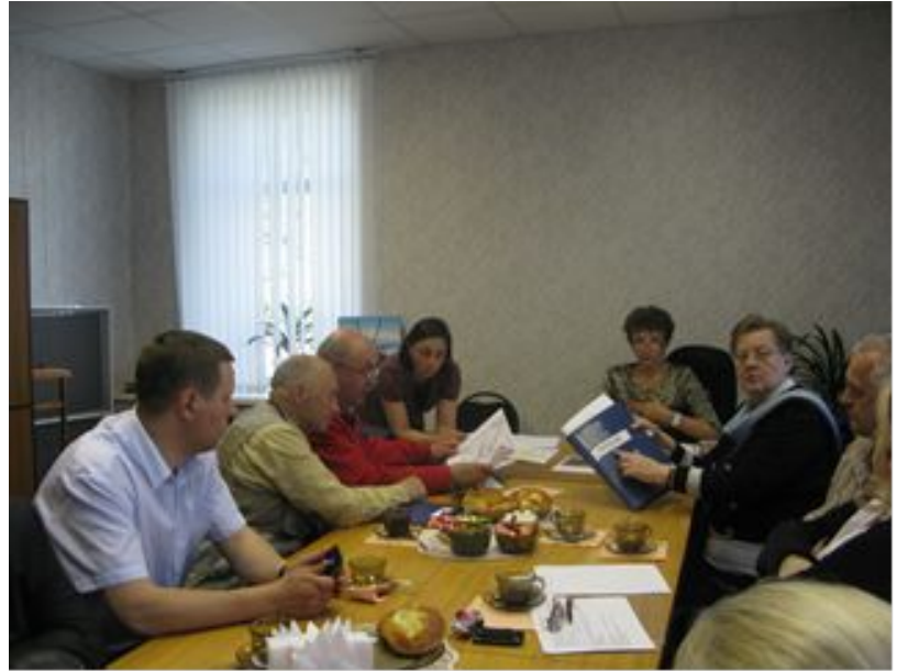
Совместное заседание по обсуждению идеи создания «Ломоносовской усадьбы». Участники: НОЦ «Ломоносовский институт» САФУ, представители руководства ОАО ЦС «Звездочка» и администрация Холмогорского района. с. Холмогоры. 29 июня 2015 г.