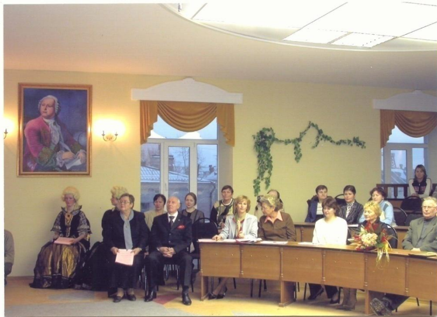
Открытие Ломоносовской аудитории