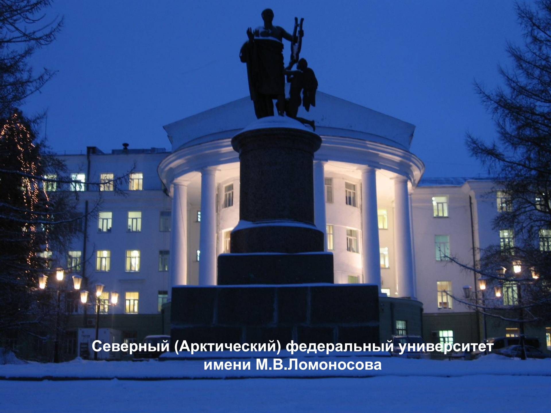
Северный (Арктический) федеральный университет имени М.В.Ломоносова