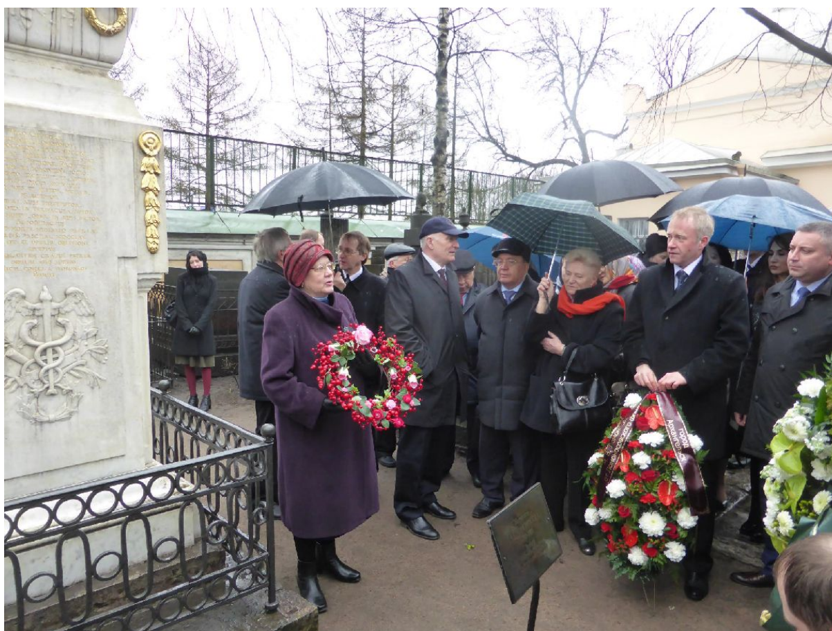
Митинг и возложение цветов к могиле М.В. Ломоносова в Санкт-Петербурге в Александро-Невской лавре. 15 апреля 2015 г., в день 250-летия памяти великого ученого