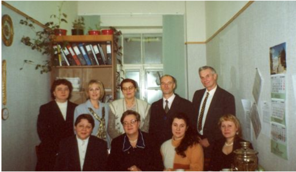
Кафедра педагогики, психологии и и профессионального образования (1999 г.)