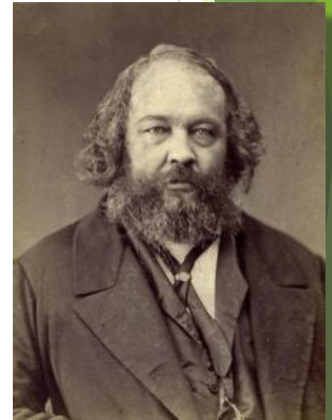
Михаил Бакунин 1814-1876