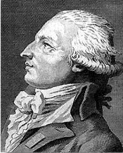
Дестют де Траси 1754-1836

Идеология – (от греч. Idea – идея, образ и logos – слово, понятие) – совокупность политико-правовых и нравственно-философских взглядов на общественно-историческую действительность