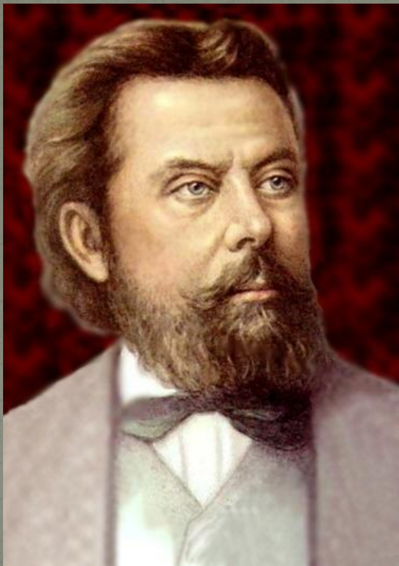
Модест Петрович Мусоргский