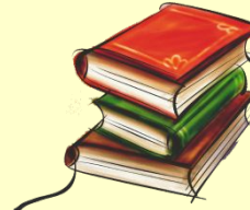
Майнові права інтелектуальної власності