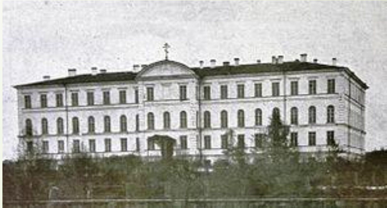
Олонецкая духовная семинария