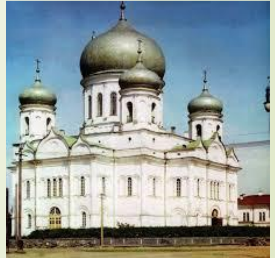
Святодуховский кафедральный собор