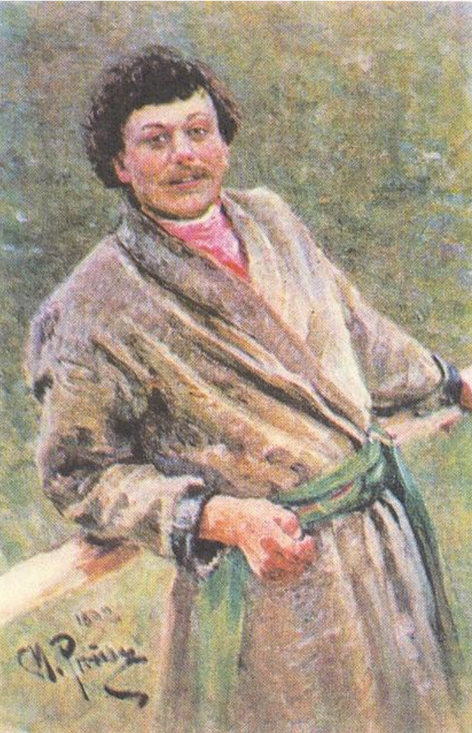
Белорус. Худож. И.Репин

Согласно переписи 1897 г. , на территории 5 западных губерний проживало 5 млн 408 тыс. белорусов, около 3,1 млн русских, поляков, украинцев, евреев, литовцев, латышей. Абсолютное большинство белорусов жили в сельской местности (более 90 %). Доля тех белорусов-горожан , которые говорили на родном языке, составляла около 14,5 %. Особенностью белорусов как этноса был раздел по конфессиональному признаку на православных и католиков . Православная церковь и католический костел не признавали существования белорусского этноса. В 1897 г. православные среди белорусов составляли 81,2 %