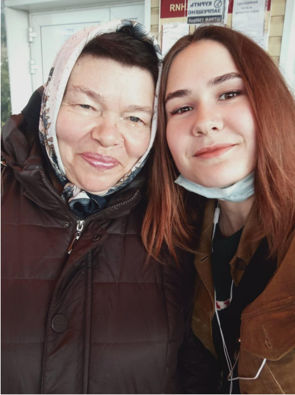
Взрослое и поколение