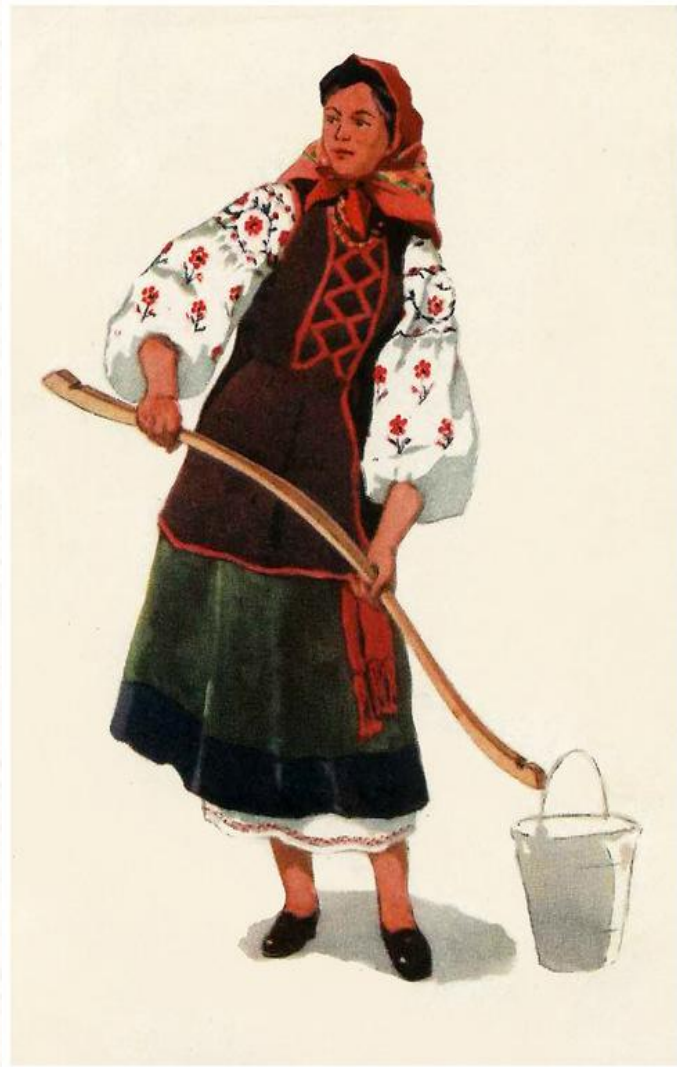
Повседневный национальный костюм