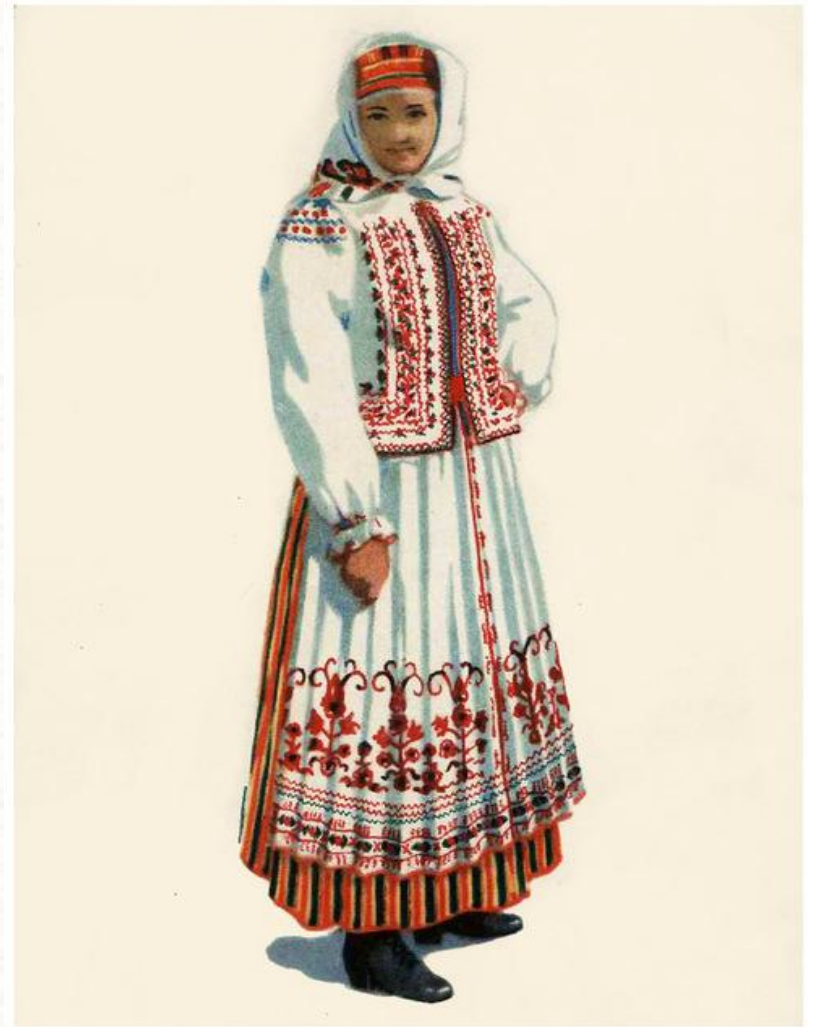
Праздничный национальный костюм