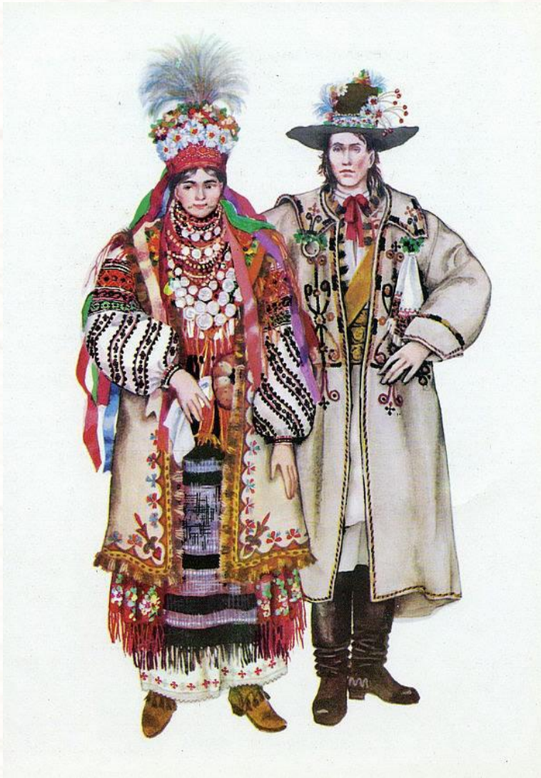
Свадебный национальный костюм