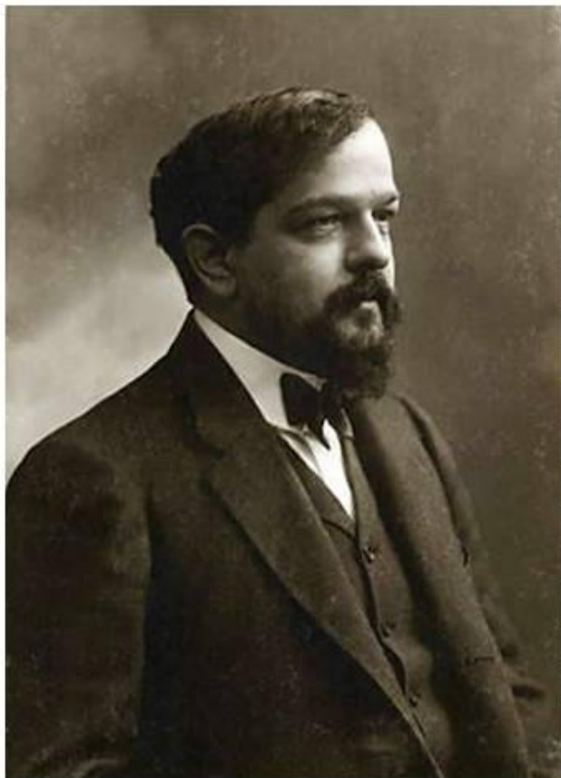
Клод Дебюсси (1862 - 1918)