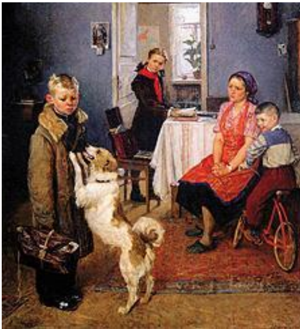
Ф. П. Решетников. «Опять двойка»