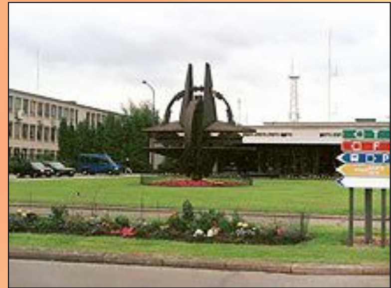
Штаб-квартира НАТО в Брюсселе