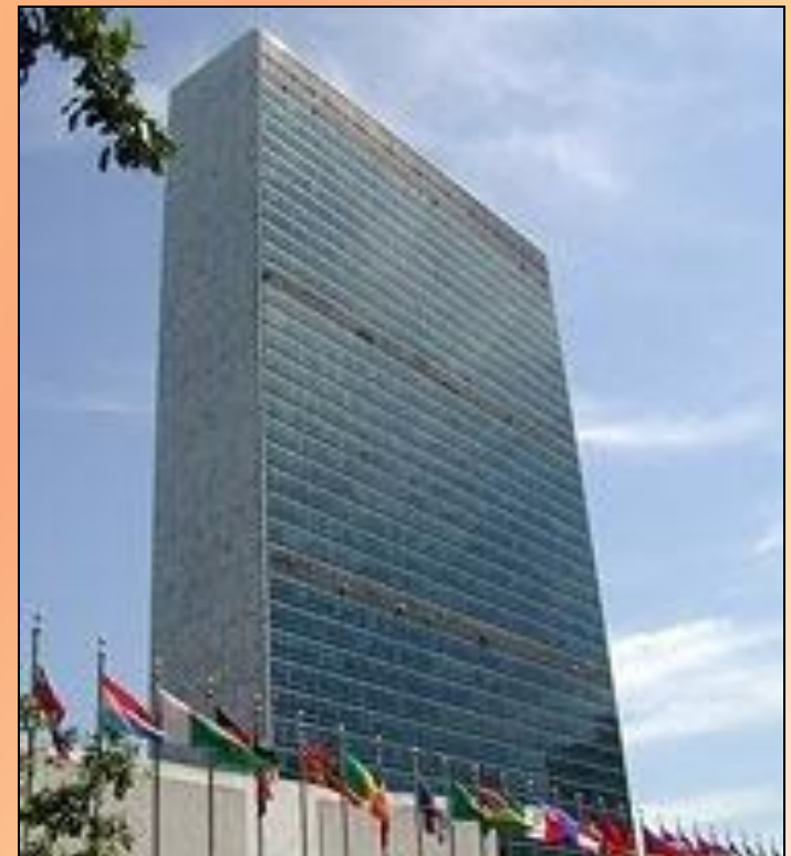
Штаб-квартира ООН в Нью-Йорке

К 2007 году в состав ООН входило 192 государство.