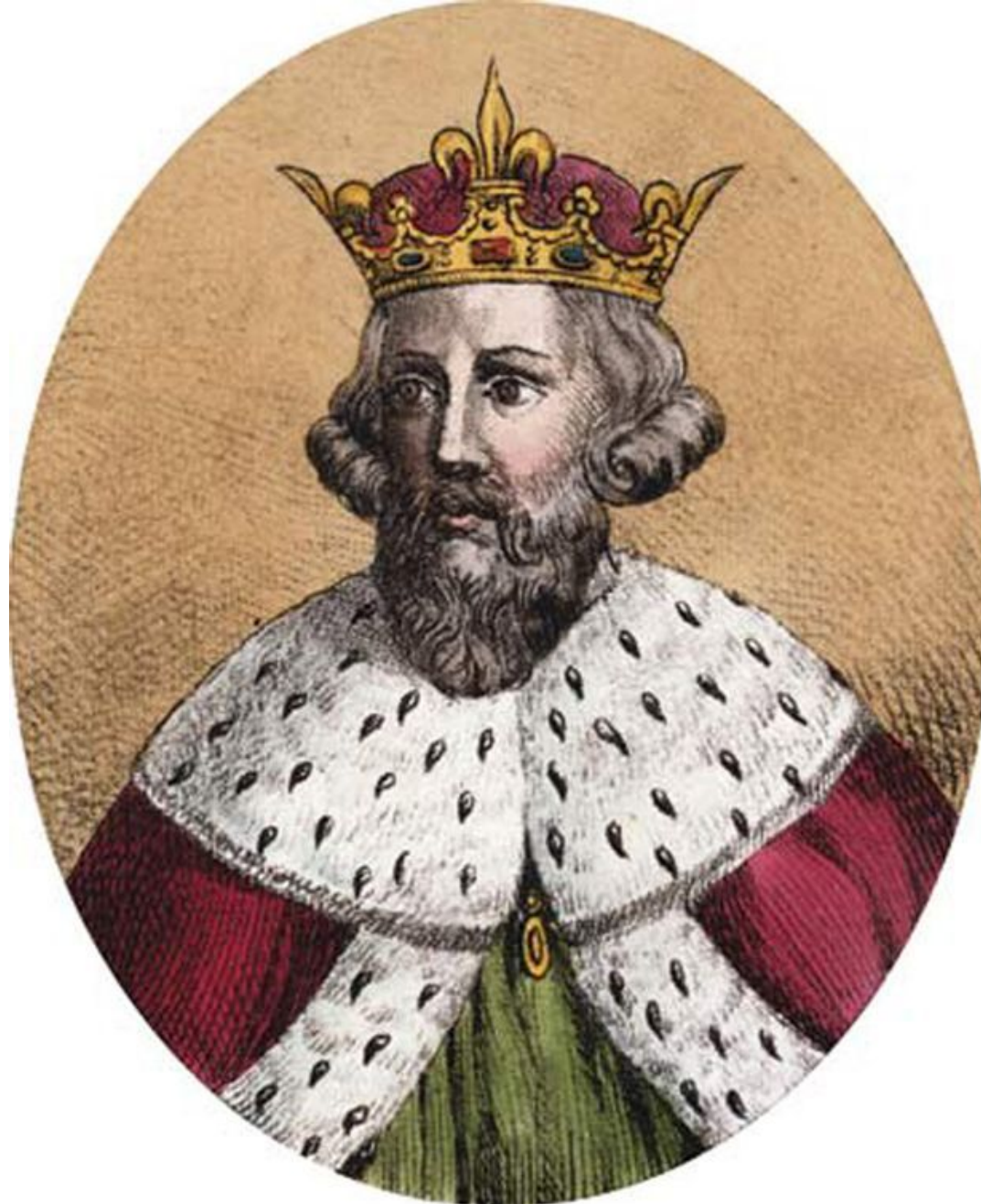
Альфред Великий (871-899/901)