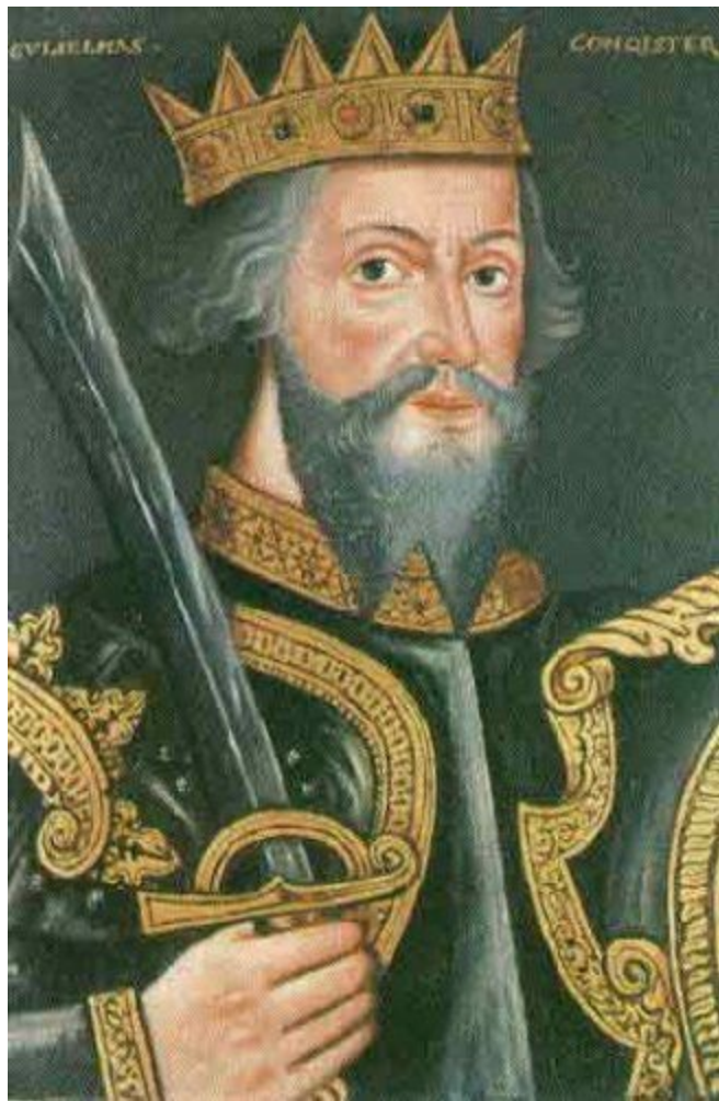
Вильгельм I Завоеватель (1066-1087)