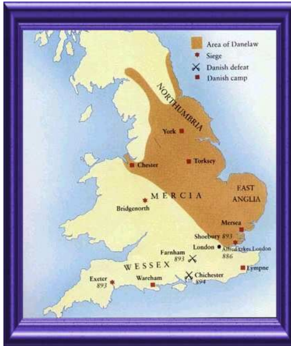
Область датского права в IX в.