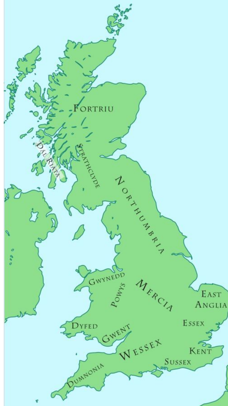
Англосаксонские варварские королевства