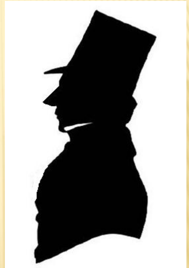
Этьен де Силуэт (1709 - 1767)

В таком рисунке не показывают черты лица или другие детали, находящиеся внутри пятна. Возродилось искусство силуэтного портрета во Франции в первой половине 18 в.