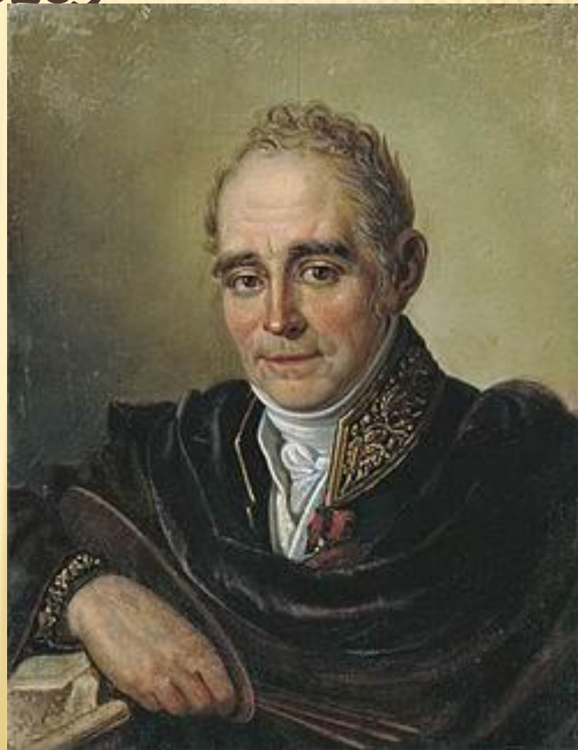
Автор-Иван Семенович Бугаевский-Благодатный

Русский художник портретист. Он внёс в русское портретное искусство новые черты: большой интерес к миру человеческих чувств и настроений. Обладая виртуозной живописной техникой, Боровиковский по праву может считаться одним из лучших русских портретистов.