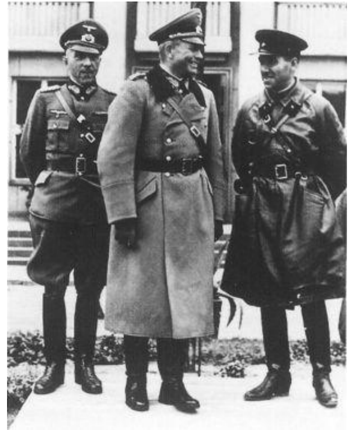
Парад советско- германских войск в Бресте