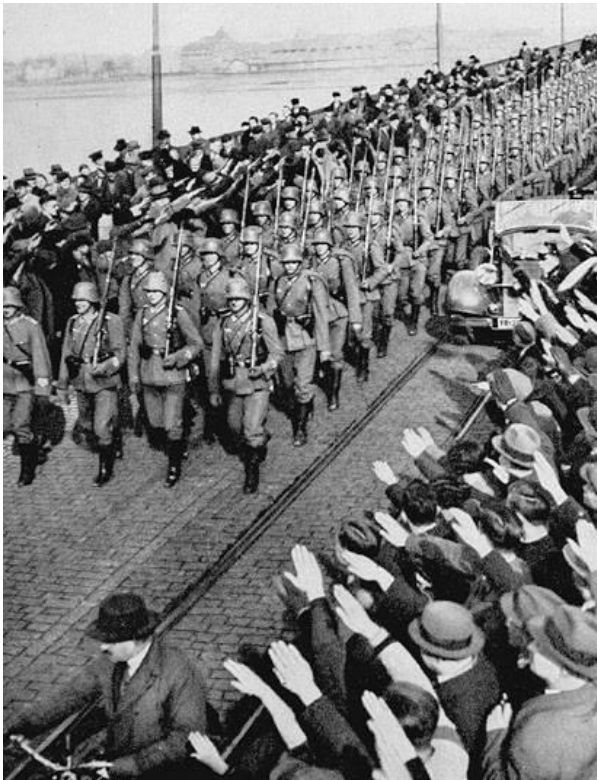
Оккупация Рейна, 1936