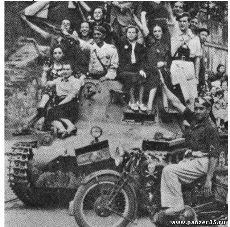
Фашистский мятеж в Испании (1936-1939)