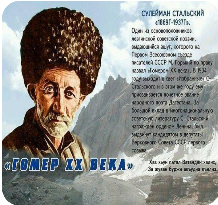
СУЛЕЙМАН СТАЛЬСКИЙ «1869Г-1937Г».

Один из основоположников лезгинской советской поэзии, выдающийся ашуг, которого на Первом Всесоюзном съезде писателей СССР М. Горький по праву назвал «Гомером XX века». В 1934 году выходит в свет «Избранные» С. Стальского и в этом же году ему присваивается почетное звание народного поэта Дагестана. За большой вклад в многонациональную советскую литературу С. Стальский награжден орденом Ленина, был выдвинут кандидатом в депутаты Верховного Совета СССР первого созыва.