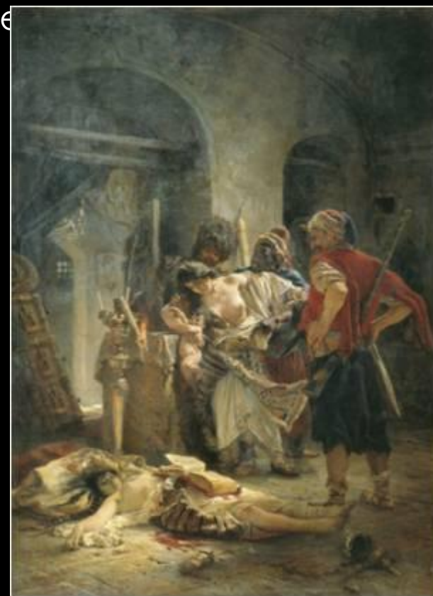
Болгарские мученицы. 1877. Маковский Константин

Получил академическую золотую медаль за мелодраматическую картину Агенты Дмитрия Самозванца убивают Бориса Годунова (1862), решенную всецело в русле романтического историзма. Написал немало сентиментальных типажей и сценок из «народного быта», в том числе популярных Детей, бегущих от грозы (1872) и трогательный образ старого слуги Алексея (1882).