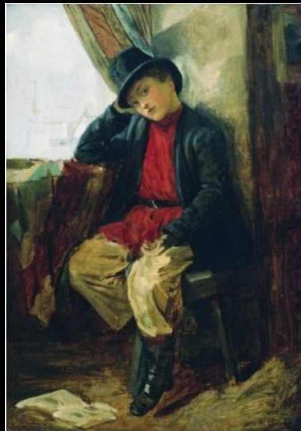
Портрет Владимира Егоровича Маковского в детстве, 1854 г.

Константин Егорович родился в Москве, в семье одного из организаторов Московского училища живописи ваяния и зодчества Е. И. Маковского