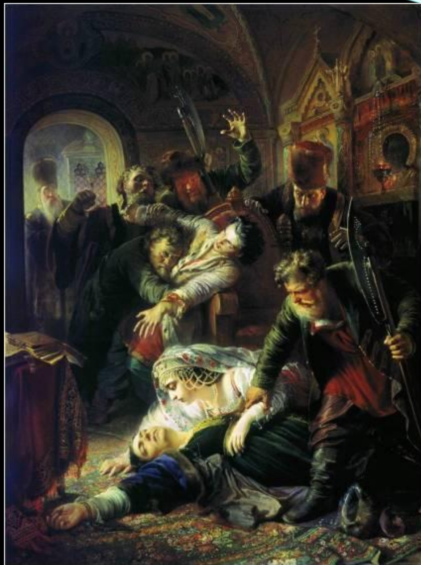
«Агенты Дмитрия Самозванца убивают Бориса Годунова» (1862)

В 1863 году Маковский, вместе с 13 другими студентами, выбранными для участия в конкурсе на Большую золотую медаль Академии, отказался писать картину на тему Скандинавской мифологии и покинул Академию, не получив диплом.