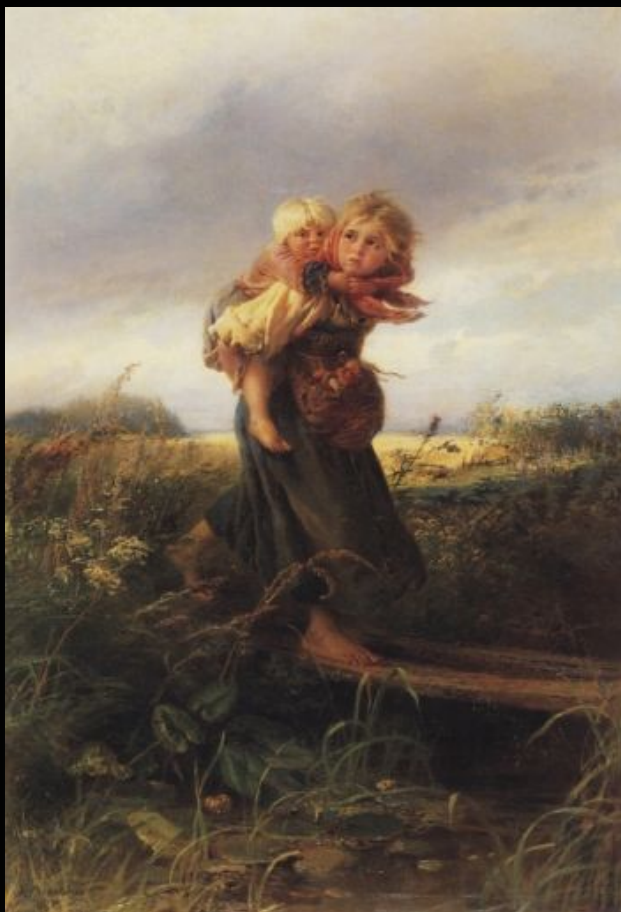
Дети, бегущие от грозы, 1872 г.