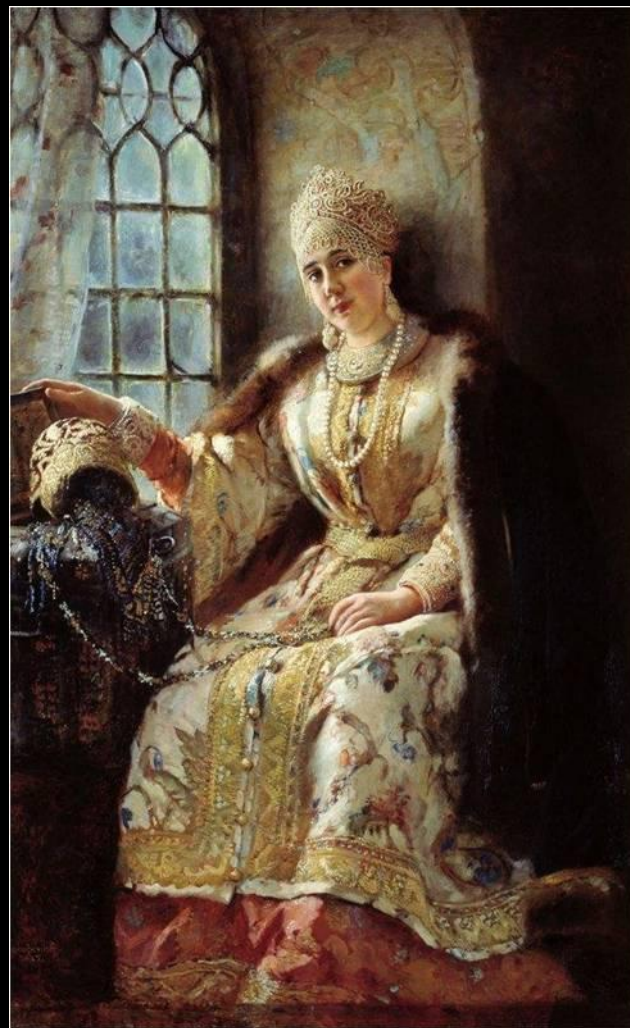
Боярыня у окна. 1885