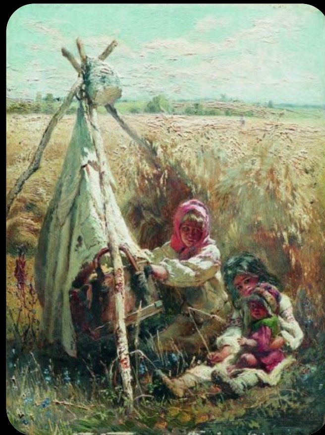
Дети в поле, 1870- е г.