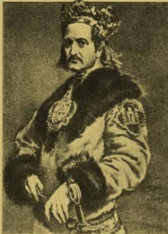
король польський і великий князь литовський Володислав II Ягайло