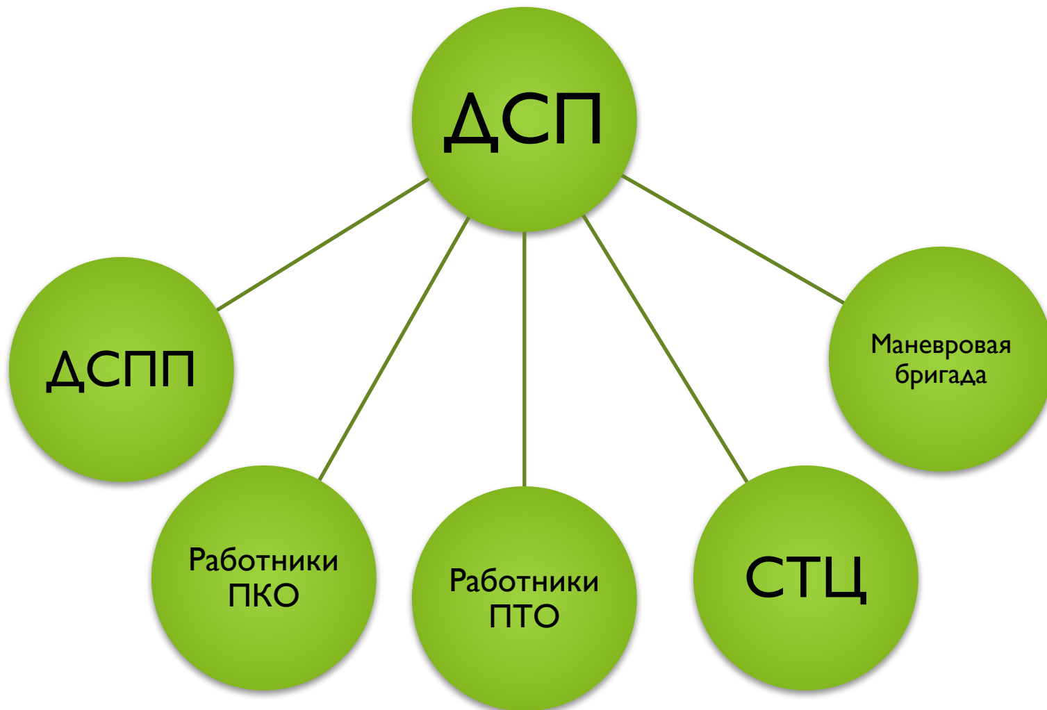
Схема оперативного руководства работой