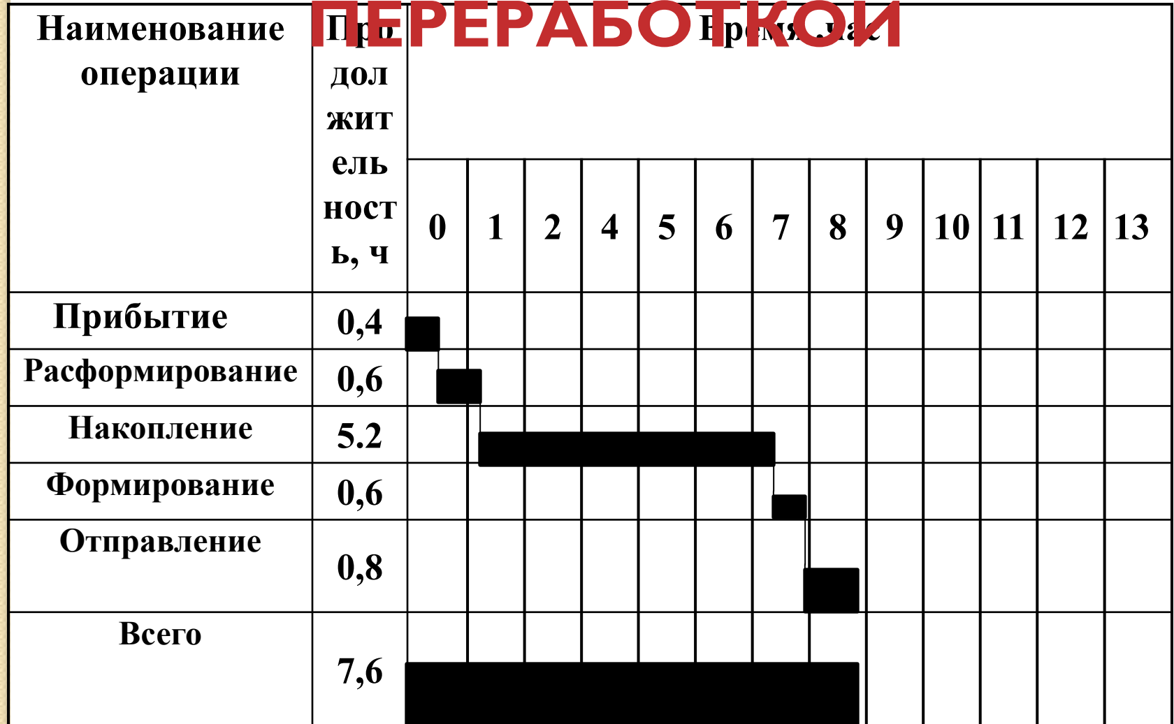
ГРАФИК ОБРАБОТКИ ТРАНЗИТНОГО ВАГОНА С ПЕРЕРАБОТКОЙ