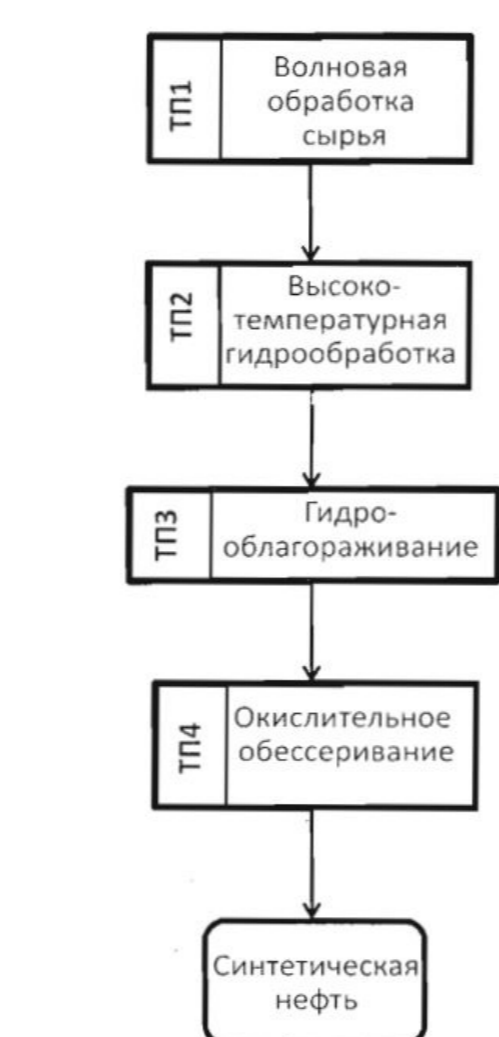
Технологическая схема процесса переработки керогенсодержащих пород в синтетическую нефть