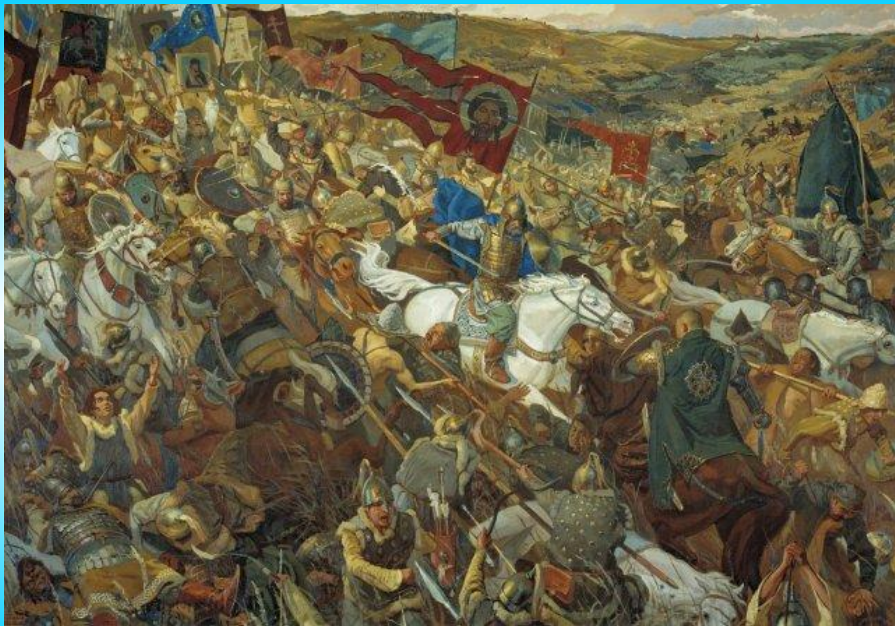
В. Маторин. Удар засадного полка