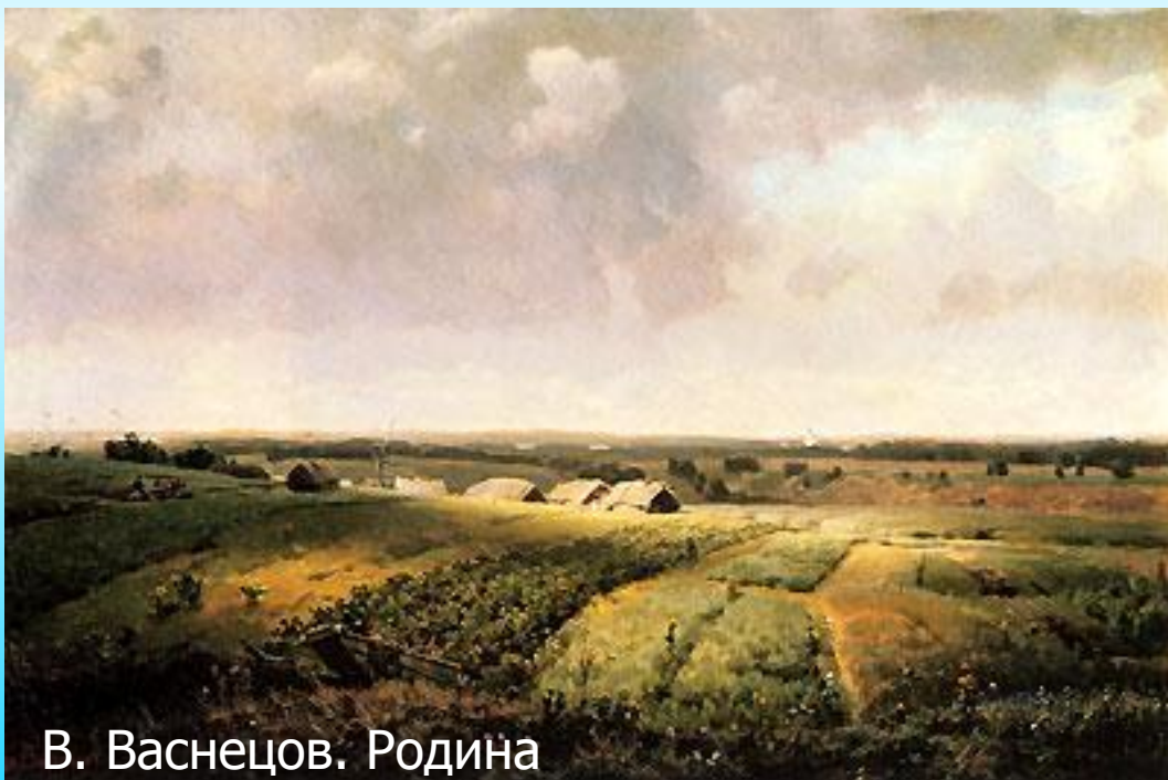
В. Васнецов. Родина