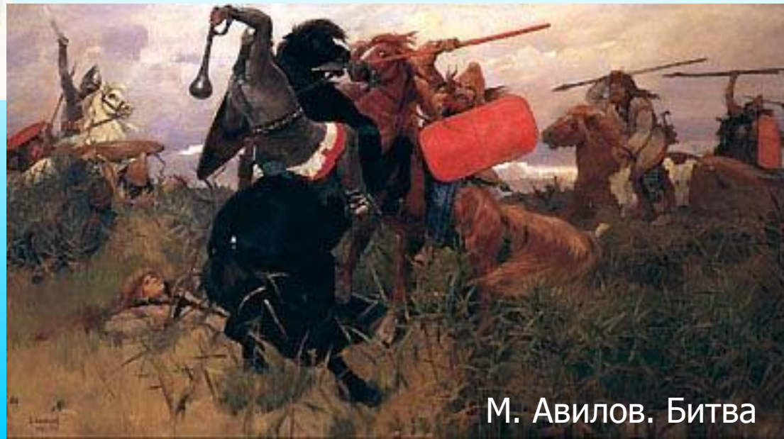
М. Авилов. Битва