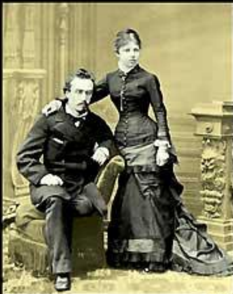
Родители А. А. Блока