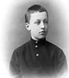
Блок - ребенок в семье. Февраль 1880 г.