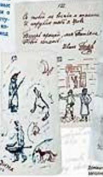
Детские стихи, Молодой Блок в 1887 г.