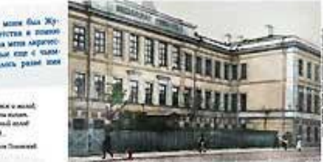
Видный русский Гербман в Пензе, где Blok родился в 1880 г.