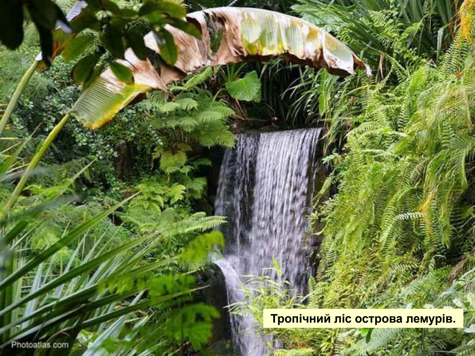
Тропічний ліс острова лемурів.