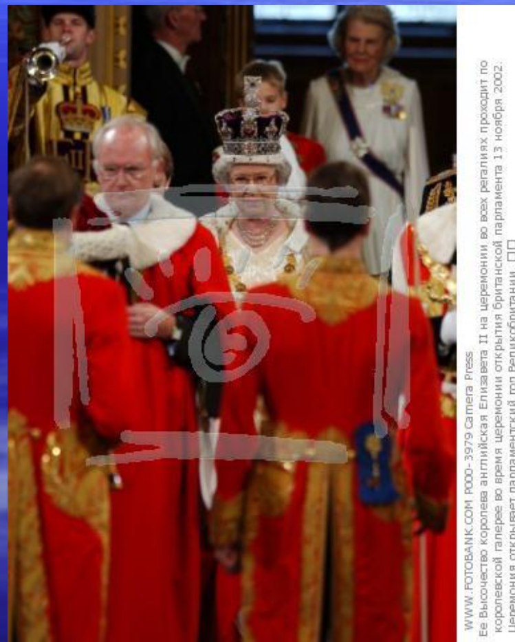
Ее Высочество королева английская Елизавета II на церемонии во всех регалиях проходит по королевской галерее во время церемонии открытия британской парламента 13 ноября 2002. Церемония открывает парламентарий год Великобритании. ПП

Королева Елизавета II произносит речь на открытии английского парламента, Вестминстер, Лондон, Великобритания, 13 ноября 2002.