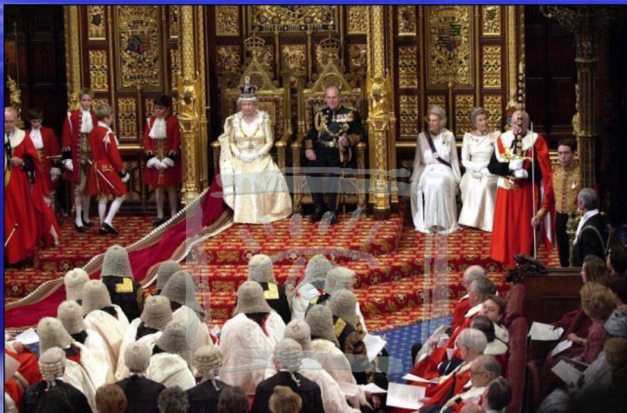
No:462053.01 Date:14.11.2002 Headline:LONDON : THE STATE OPENING OF PARLIAMENT... Caption: THE QUEEN SPEECH AT THE STATE OPENING OF PARLIAMENT...