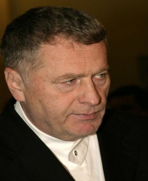
Владимир Вольфович Жириновский – российский политический деятель, лидер политической партии ЛДПР. Родился 25 апреля 1946 года в Алма-Ате.