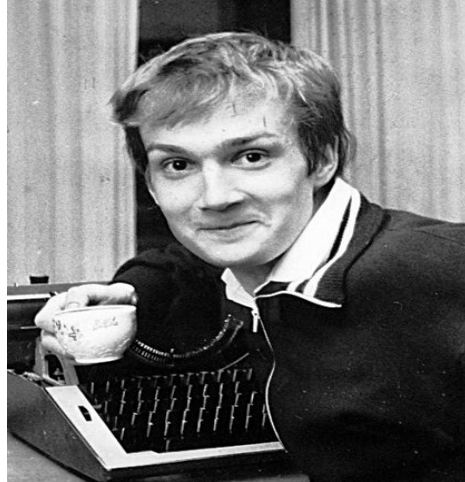
Владислав Николаевич Листьев журналист. первый генеральный

Александр Иванович Лебедь –газеты «Московский комсомолец» Дмитрий Юрьевич Холодов родился 21 июня 1967 года в городе Сергиев Посад. Д. Ю. Холодов вырос в подмосковном городе Климовск, учился в школе №5, которая сегодня носит его имя. Он работал военным корреспондентом в газете «Московский комсомолец», занимался журналистскими расследованиями, писал о нарушениях в Вооруженных силах РФ.