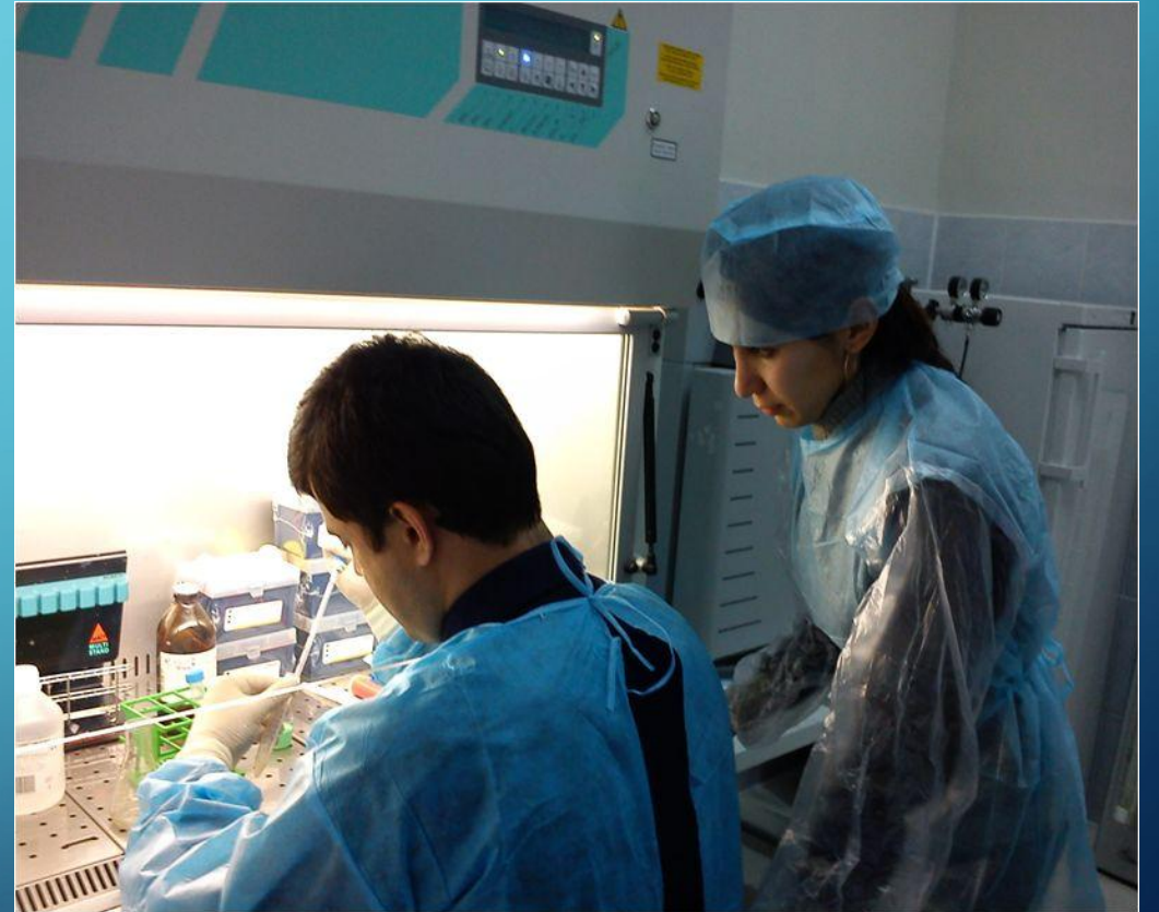
Сбор стволовых клеток