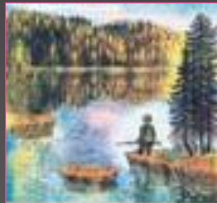
«Васюткино озеро». Худ. С.Сюхин. 1990