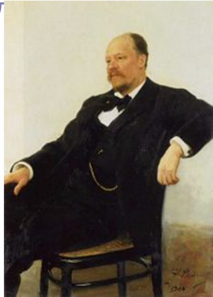
Анатолий Константинович Лядов. Портрет работы И. Репина (1902)