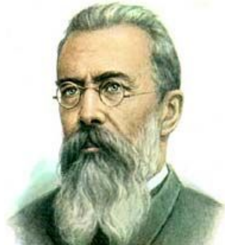
Н.А.Римский - Корсаков