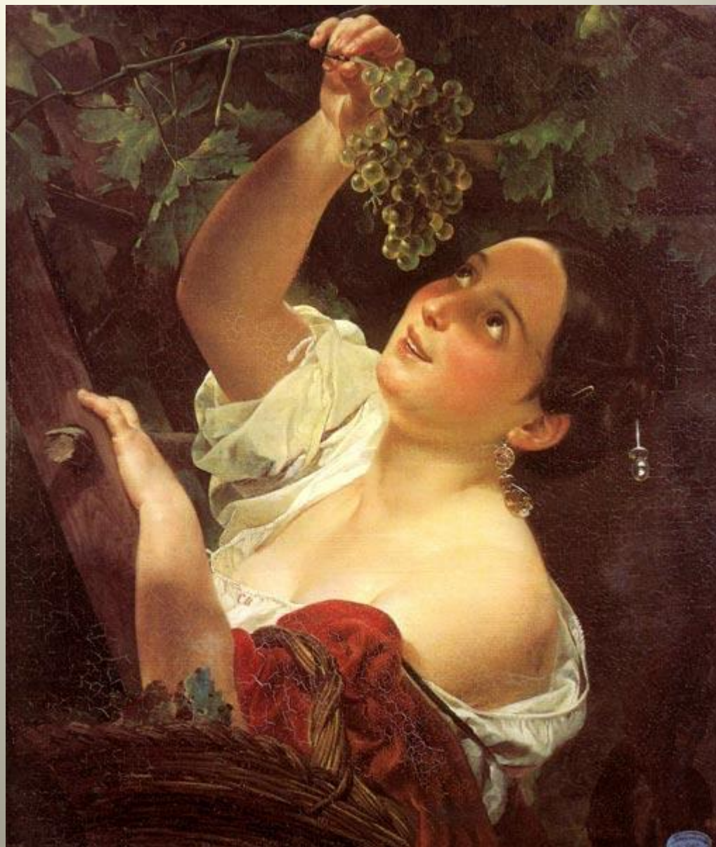
К. П. Брюллов Итальянский полдень