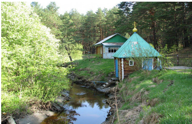
Чимеевский святой источник