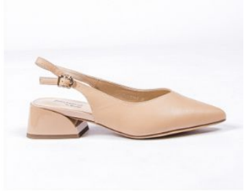
Туфли открытые Тофа