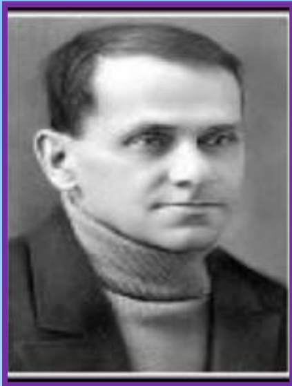
Блонский Павел Петрович