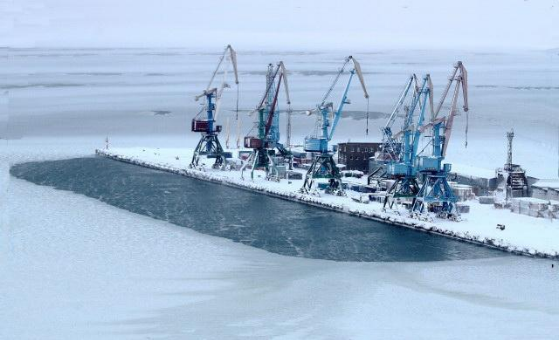
В Холмском морском порту