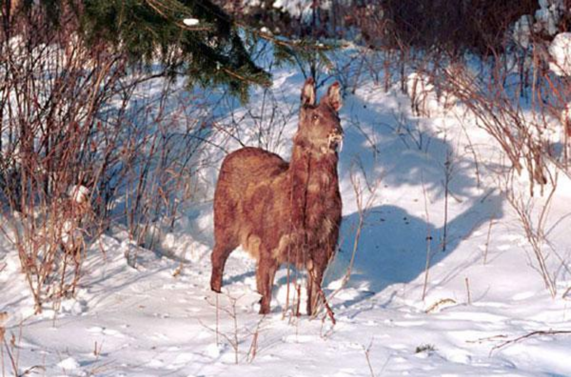
Государственный природный заказник «Макаровский» Сахалинская кабарга