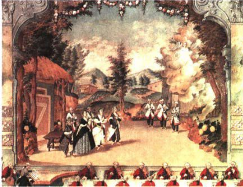
Представление оперы Й. Гайдна «Непредвиденная встреча» в театре князя М. Эстерхази в 1775 г.

Творчество Гайдна уже при жизни получило европейскую известность и по достоинству было оценено современниками. Музыка Гайдна - это « музыка радости и досуга », она полна оптимизма и действенной энергии, светла и естественна, лирична и изысканна.