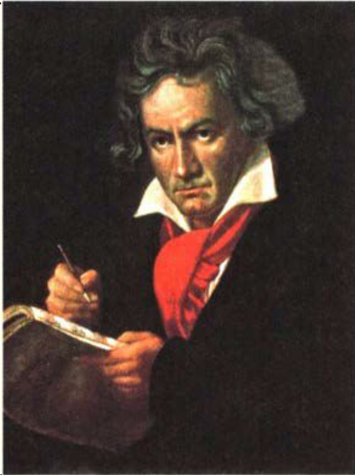
Й. Штилер . Портрет Л. ван Бетховена. 1819-1822 гг. Музей Бетховена, Бонн