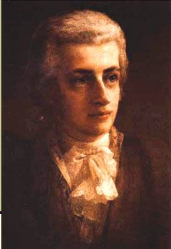
Иоганн Хризостом Вольфганг Теофил Моцарт