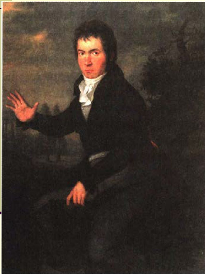
Й. Мелер. Портрет Бетховена. 1804-1805 гг. Музей истории города, Вена