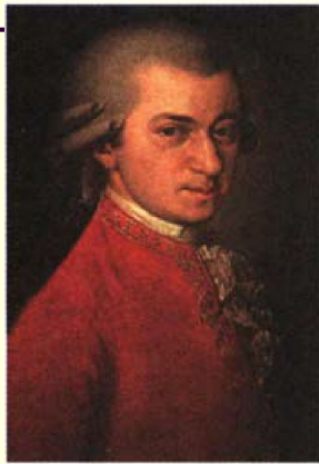
Б. Крафт. Портрет Моцарта. 1814 г.

Творчество Моцарта представлено также выдающимися сочинениями духовной музыки: мессами, кантатами, ораториями. Вершиной его духовной музыки стал «Реквием» (1791) грандиозное произведение для хора, солистов и симфонического оркестра. Смертельно больной Моцарт не успел закончить это произведение. По наброскам композитора оно было доработано одним из его учеников.