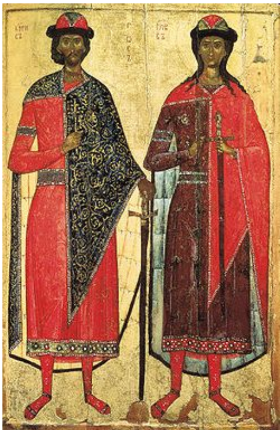
Братья Борис и Глеб - первые русские святые