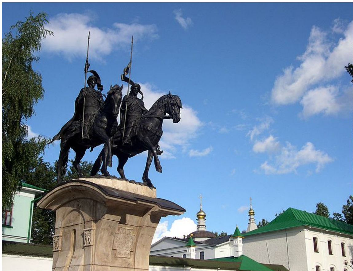
Памятник Борису и Глебу у стен Борисоглебского монастыря в Дмитрове (2006 г., скульптор А. Ю. Рукавишников)