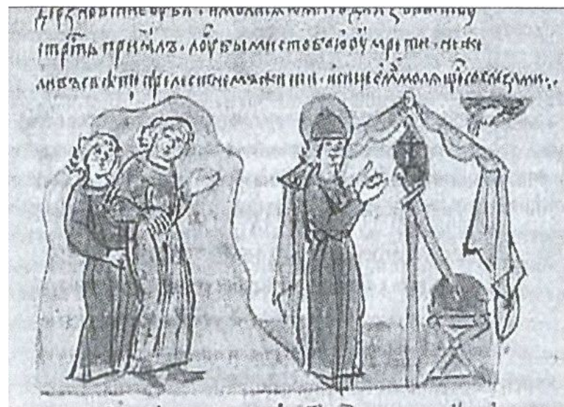
Убийение Глеба Владимировича. Миниатюра Радзивилловской летописи

Смерть юных братьев потрясла русское общество