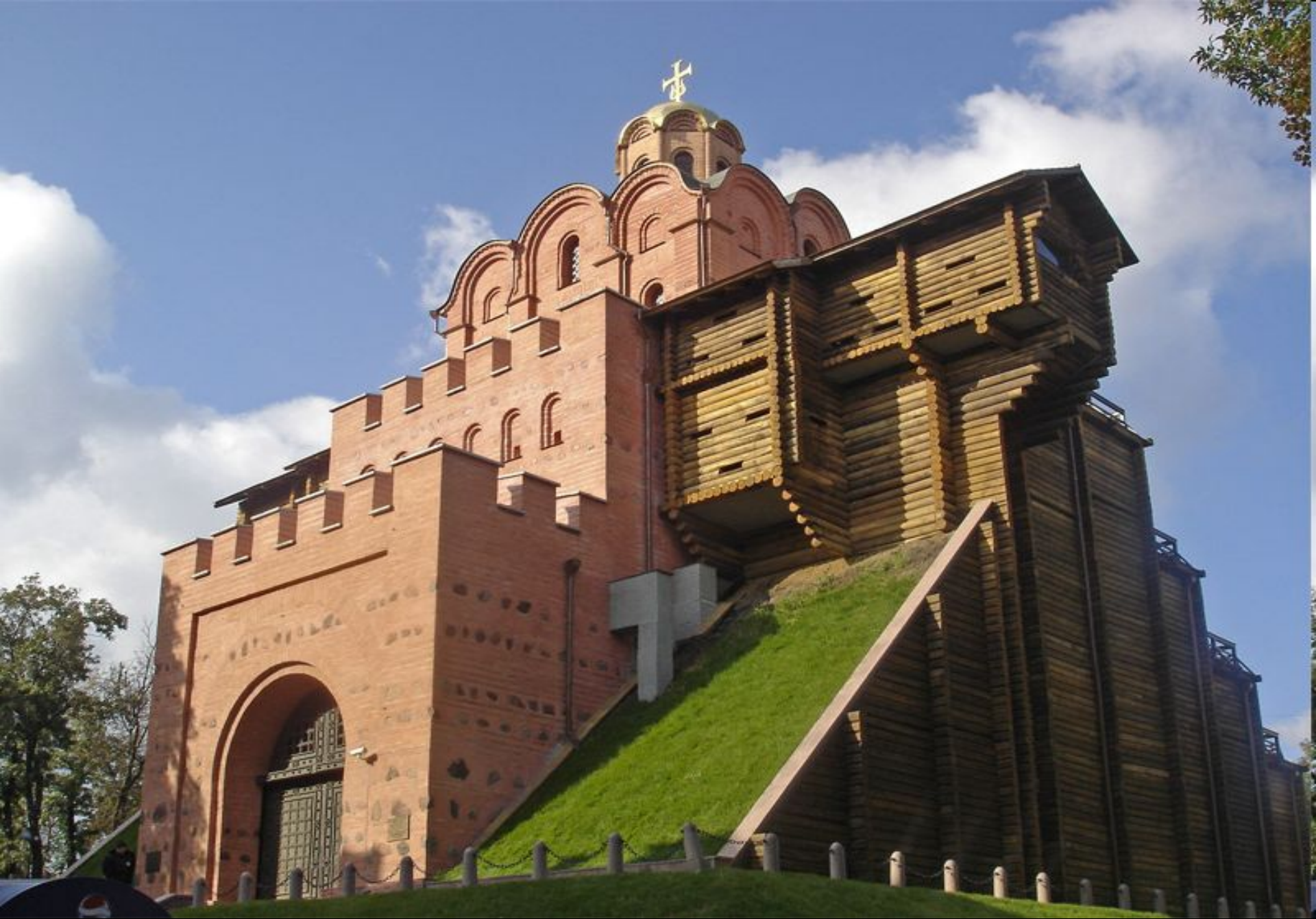
Золотые ворота в Киеве